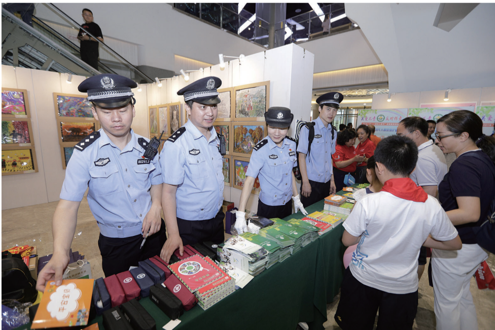
6月2日,民警在活动现场向家长和孩子发放防拐宣传材料。

新华社北京6月2日电(记者 白阳) 公安部儿童失踪信息紧急发布平台“团圆”系统上线三年来,共发布走失儿童信息3978条,找回3901名失踪儿童,找回率达98%。