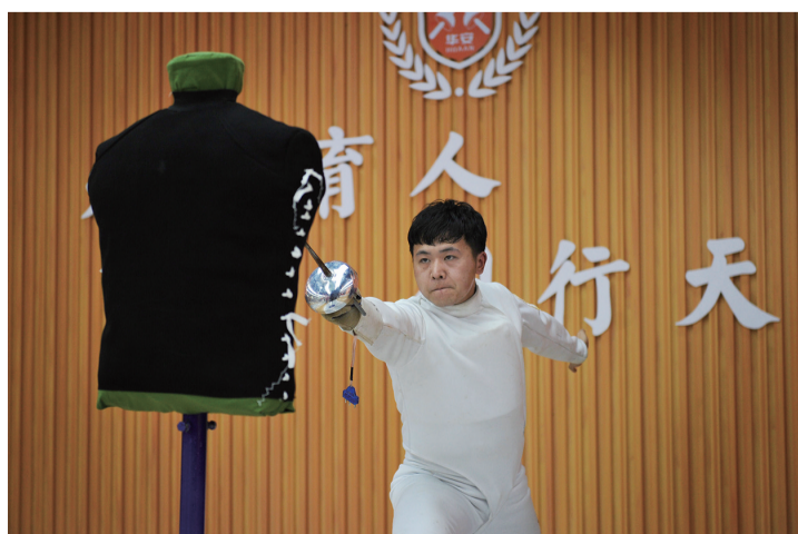
课余时间一位教练在独自练习。

“预备!开始!”随着口令声响起,头戴护具、身着专业服装的击剑小选手犹如中世纪的骑士,用手中的剑优雅地在空中划出一道弧线。屏息凝神间,剑与剑的碰撞声仿佛将人带回18世纪法兰西这项贵族运动的鼎盛时代。 击剑运动近年来才引进株洲,我市击剑运动协会2017年才成立,2018年湖南省第十三届运动会击剑比赛上,株洲击剑队发挥出色,拿下了2金4铜的好成绩。 击剑运动的发展从娃娃抓起,这项被视为“绅士、贵族的运动”已经走进了株洲的中小学。今年3月,株洲首个击剑馆——建宁击剑馆挂牌成立,并挂牌省市两级击剑运动后备人才培养基地。与此同时,白鹤小学、凿石小学、市一中等株洲多所中小学校纷纷开展“击剑进校园”活动,目前全市有数百名击剑爱好者。 据了解,击剑馆不仅要满足全市青少年的击剑培训,作为市击剑队的训练场地,将参与对我市击剑队花剑、重剑、佩剑3个剑种、5个年龄梯队运动员的训练,还要承办全省性的击剑比赛。今年8月举行的全省青少年击剑锦标赛也将在我市开赛,届时全省各地的击剑苗子将齐聚株洲“论剑”。