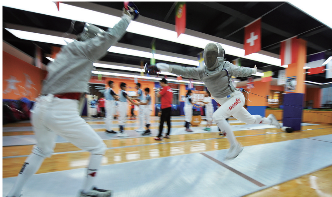
教练示范实战刺杀。