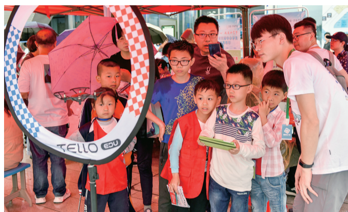
无人机实践操作,人气旺盛。