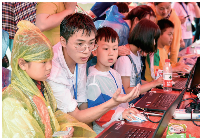
细雨不断,孩子们穿着雨衣坚持参加活动。