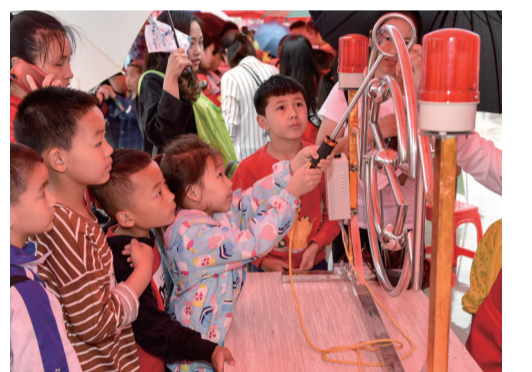
孩子们参与活动项目,非常投入。