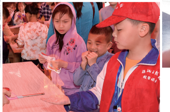
神奇的“火焰学”,让旁观的小伙伴们感觉很神奇。