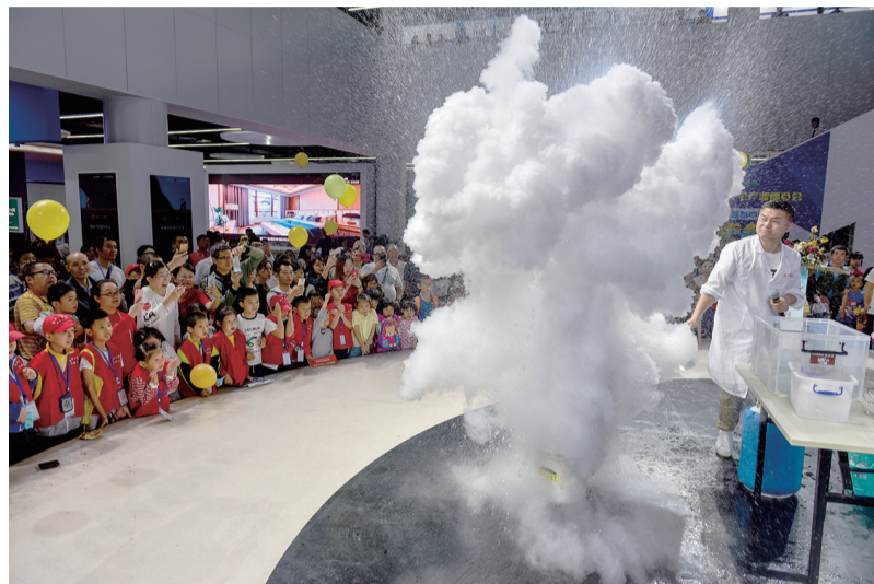
趣味化学实验,让参观的孩子和家长惊奇不已。