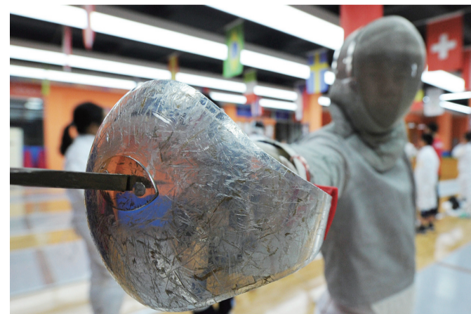
历经过多次对抗的剑柄已是伤痕累累。