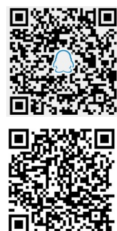
晚报乐活周刊QQ读者群

特别提醒:本刊登载的文章、美术作品均有稿酬(纸质版、电子版、微信版稿酬合一),凡未收到稿酬的作者,请与本刊编辑部联系。作者如无特殊声明,即视为同意授予本刊及本刊微信版、本刊合作网站信息网络传播权,本刊支付的稿酬包括此项授权的收入。