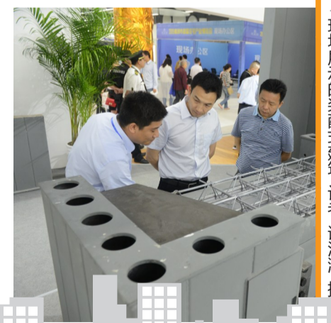
▲现场展示的建筑模型