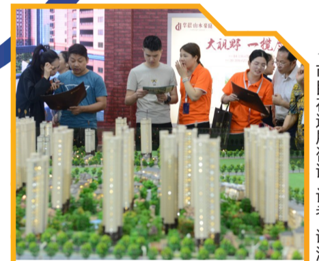
▲市民在逛展咨询