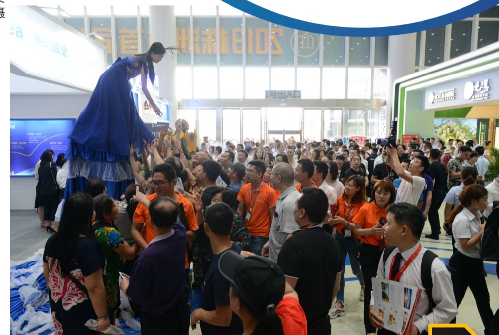
▲人头攒动的展厅

昨天上午,株洲汽博园首届住博会展馆内,人头攒动。中国风、小清新、黑科技;或古典典雅、或灵动大气、或西式风格;现场的每一家展厅,根据产品自身特色,布置精美,让人想一探究竟。 将工作人员装扮成《复仇者联盟》中的冬兵、古一法师、黑寡妇等核心成员;来逛展位,可免费领取礼品;展厅内现场体验AI智能家居生活;推出特价优惠活动……每一家参展企业,都使出浑身解数,期望吸引前来逛展的市民。 组委会举办的广场舞大赛、少儿科技嘉年华、音乐啤酒节、微信手机秀、幸运大抽奖、大型恐龙展等一系列活动,也让市民除了逛展外,还可以享受更多的娱乐。 展会位置离中心城区较远,组委会特意开通了免费的“住博直通车”,展馆一楼中心区域设有小卖部,二楼的公共餐厅可容纳千人就餐。 你不想到现场来看一看吗? (记者 周嵩 通讯员 李艳艳)