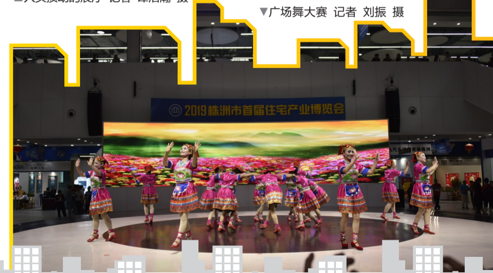
▼广场舞大赛