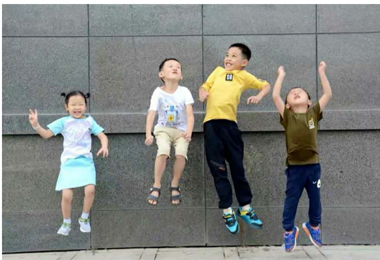
▲快乐童年,4位小朋友欢呼跳跃