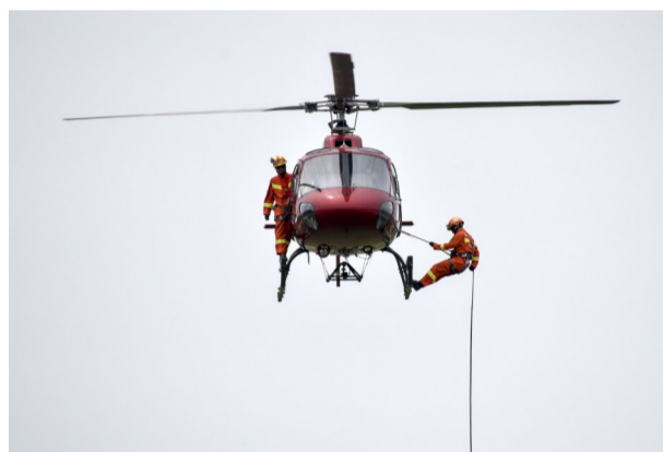
▲航空救援大队正在开展高空索降救援演练