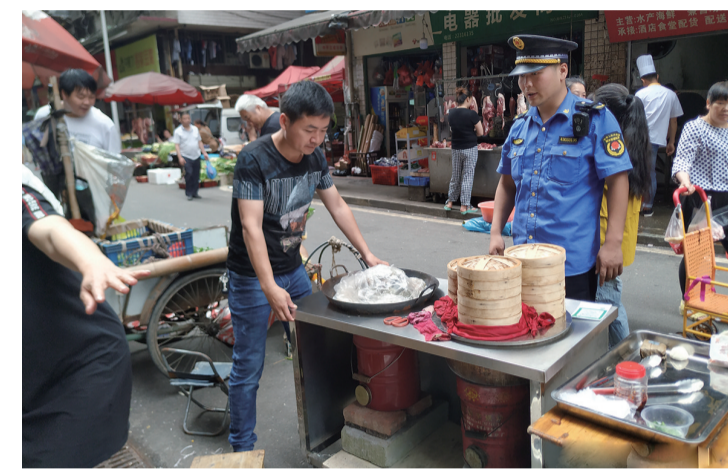
面对城管队员整治,摊贩主动撤走摊位

昨日,有市民拨打晚报新闻热线28829110反映:荷塘区合泰农贸市场外面的马路上每天都摆满了卖菜、卖小吃的流动摊点,成了马路市场。