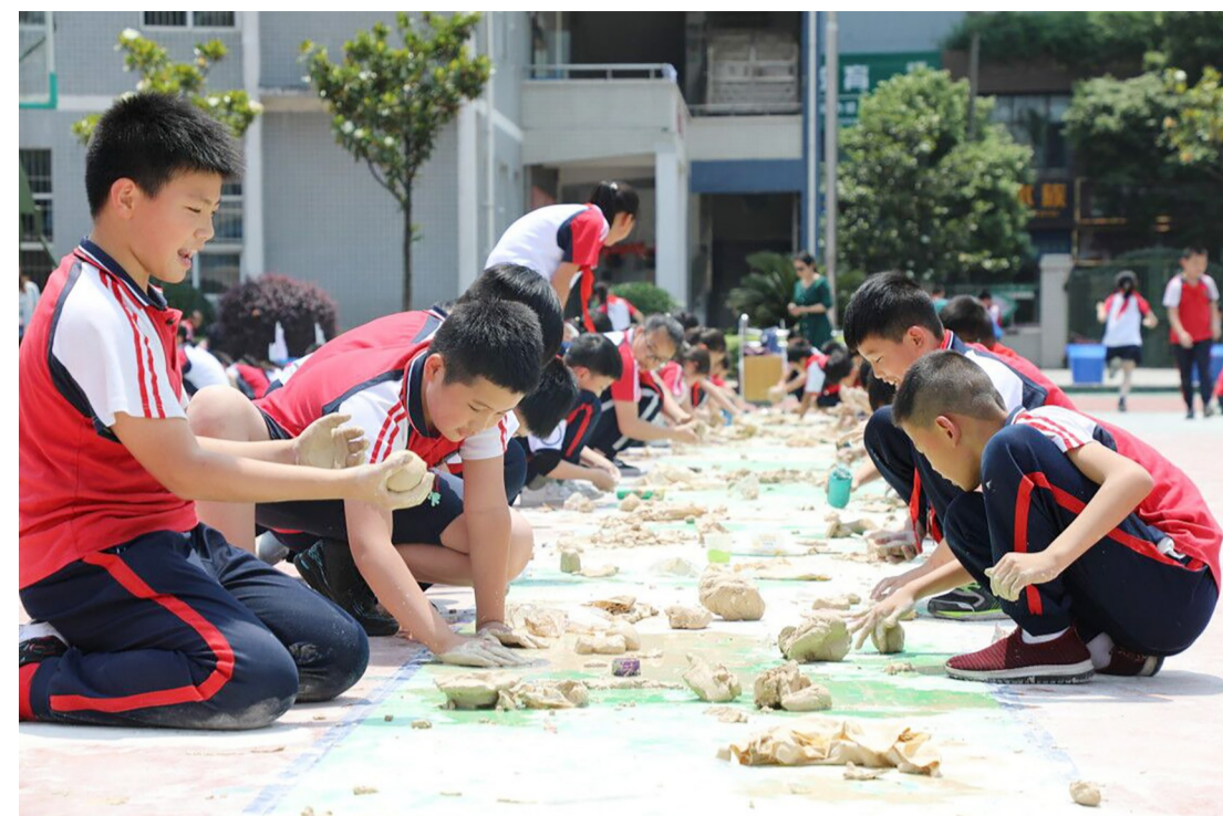
▲昨日，天元区银海学校操场，孩子们在快乐地玩泥巴

最终，本次大赛共评出一等奖项目1个、二等奖项目2个、三等奖项目3个，部分优秀项目将被推荐参加市级比赛。