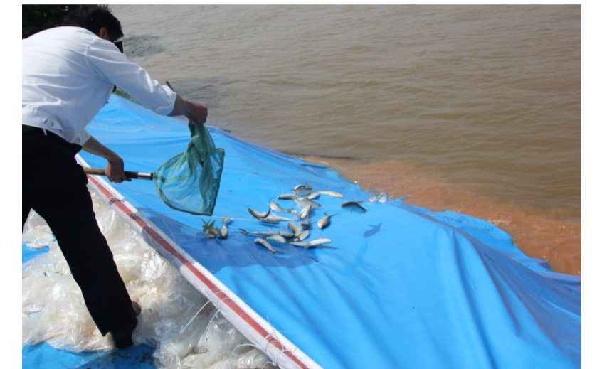
▲放流鱼苗现场

本报讯(记者 姚时美)昨日上午,市水运建设投资集团有限公司和淠口区渔政监督管理站开展大型增殖放流活动,共计放流鱼苗415万余尾。