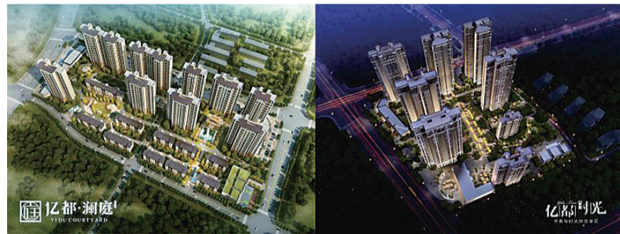
▲亿都·澜庭与亿都·时光

株洲市亿都房地产开发有限责任公司(以下简称“亿都”)成立于1993年,具有国家房地产开发二级资质证书。亿都的发展经历了从市政项目到商业地产,从单项项目到多项目,积累了丰富的开发经验,在推动产业进步,促进城市发展、提升城市价值等方面作出了积极贡献。