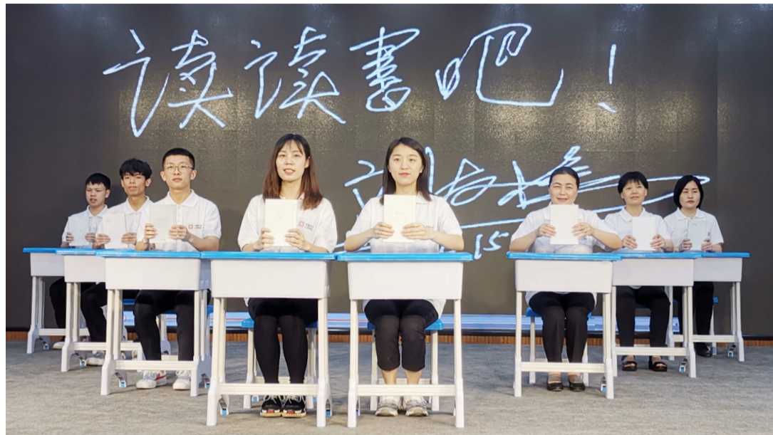
▲市阅读联合会授牌暨表彰大会现场,阅读推广表演

本报讯(记者 肖蓉 通讯员 严丹)5月28日,市阅读联合会授牌暨表彰大会在市图书馆举行,共评选出最美读书会5家、优秀读书会5家、优秀阅读品牌8家、优秀阅读推广人10人。这些组织和成员长年致力于全民阅读推广工作,让更多的市民多途径爱上阅读,提高市民阅读素养。