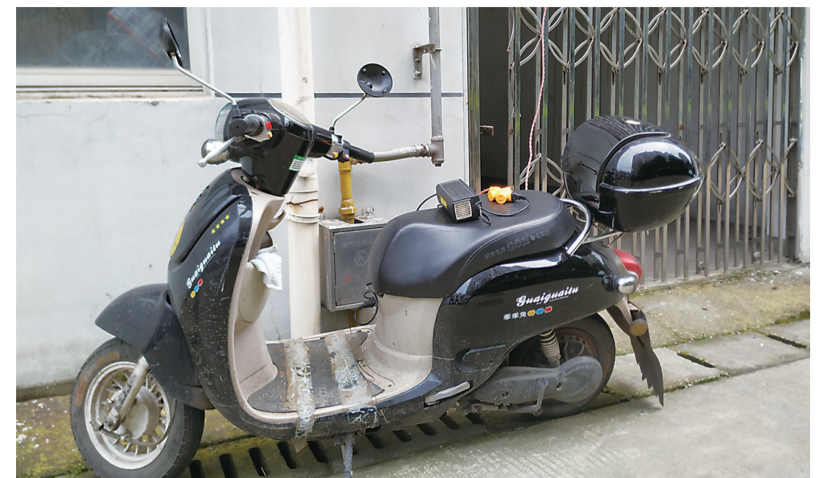
▲昱峰花园小区电动车飞线充电

连日来,我市也有不少市民拨打晚报热线,反映小区普遍存在私接电线给电动车充电的现象,消防安全隐患极大。对此,记者近日展开了走访调查。