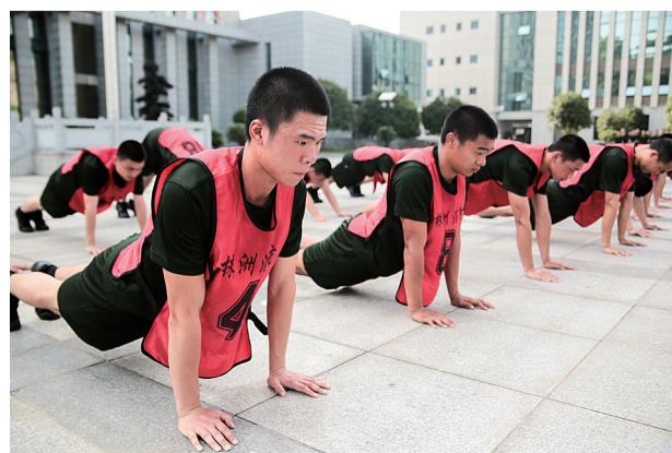
每天要完成100个「体能训练」，100个俯卧撑算是热身。