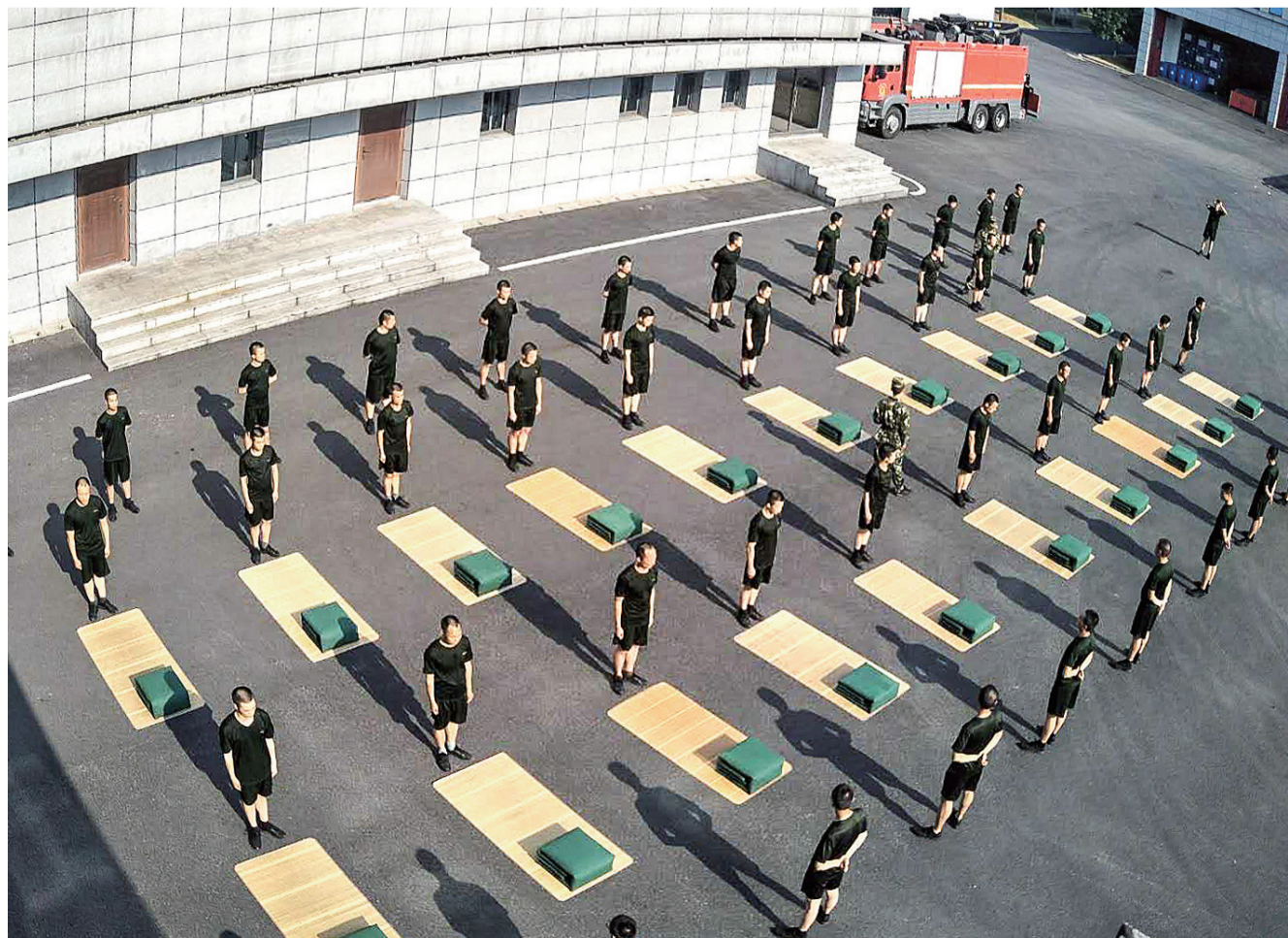
全队开展“正作风 强内务”叠被比赛，讲究被子要叠得像豆腐块一样。

到处洋溢着青春的气息，激昂的斗志，当阳光普照在绿色的营房，这就是梦开始的地方。5月23日，在市消防救援特勤中队训练基地，54位新入选的政府专职消防员通过考核，即将被分配到全市各中队当中，开启自己的“火焰蓝”追梦之旅。一个月前，市消防救援支队迎来120张年轻而青涩的面孔，他们来自祖国五湖四海，将在这里展开为期一个月的集训，接受红门的洗礼。平时多流汗，战时少流血，很快，他们就进入了“魔鬼训练”。全队要求早上6点准时出早操，队列训练雷打不动。3公里跑、100个俯卧撑、100个仰卧起坐、100个深蹲、水带负重训练一个也不能少。晚上还要进行政治、理论学习。为了丰富学员们的生活，根据学员的训练实际，全队定期开展各项文体活动和内务竞赛，充分调动队员“比、学、赶、超、帮”的热情，提高他们的凝聚力和集体荣誉感。红门意气激起男儿热血，每天训练哪个班成绩第一，内务红旗花落谁家，每一项小小的荣誉都能让整班的队员“与有荣焉”。3千米达标的超过三分之二，引体向上的平均成绩超过20个；超过9成的队员能在10秒内完成速度爬梯要求……1个月魔鬼训练下来，集训队的成绩有了稳步提高。“他们已经完成了蜕变，越来越有消防员的样子。”带兵排长这样说。但考核毕竟是残酷的，这120名队员当中，只有54名最终能留下来。如今，虽然消防部队改制，但始终不变的是肩上的重担和心中的使命。