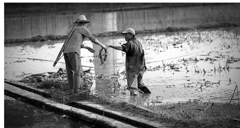
给路过的熟人递一根藕尝个新鲜。