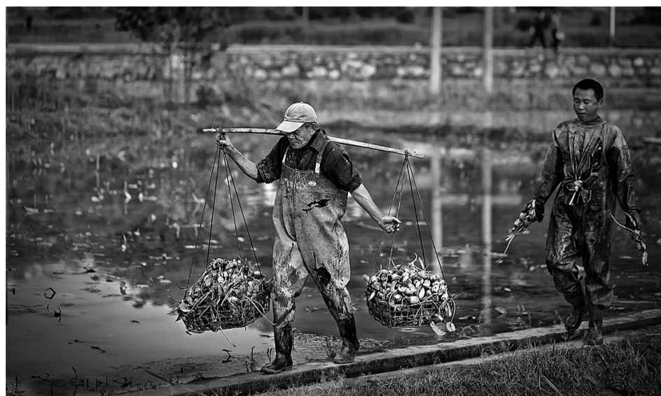
新鲜的莲藕从田间地头运往市场销售。