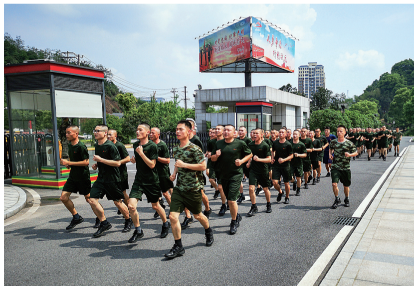
烈日下，队员们喊着嘹亮口号，踏着整齐步伐前进。