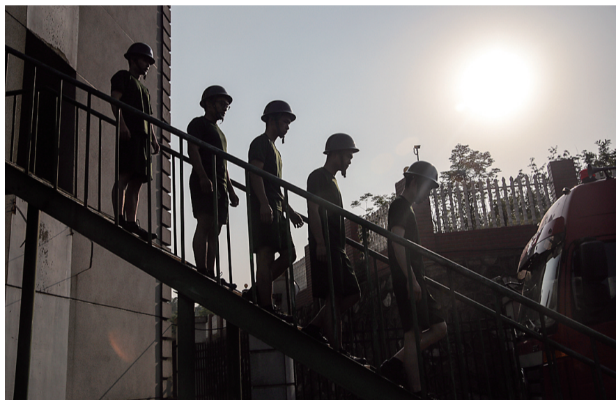
落日余晖下，他们结束了一天高强度训练。