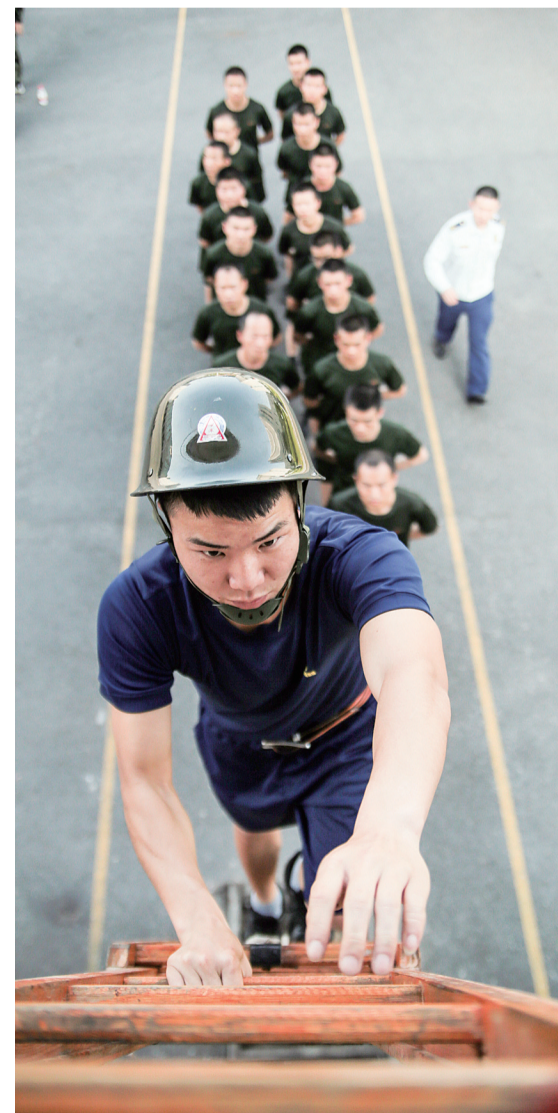
眼睛盯着楼梯，手脚协调一致，经验丰富的老兵给新队员演示爬梯动作要领。