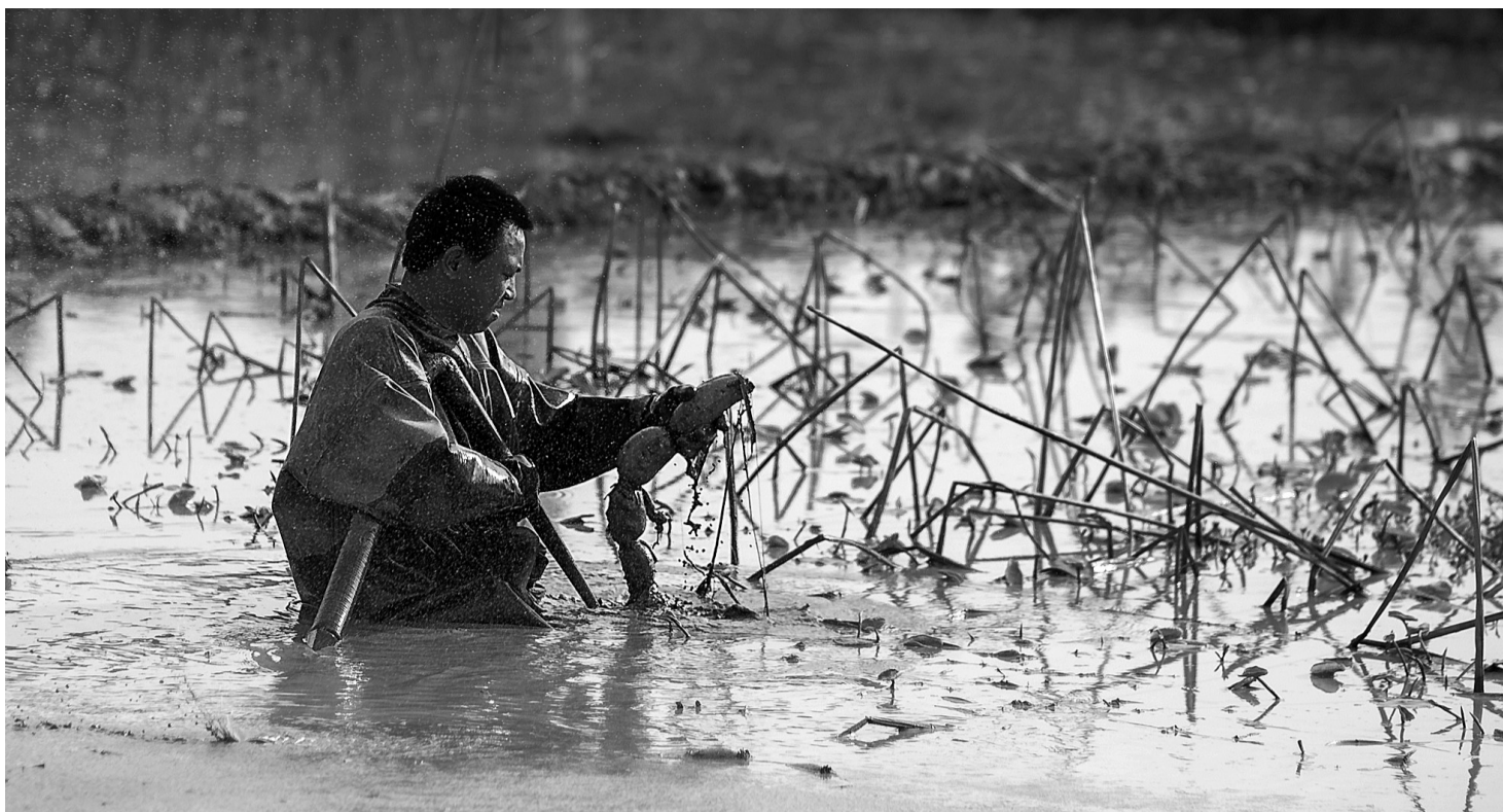
挖藕人在田里忙碌。