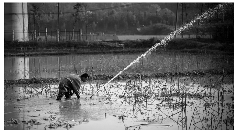
高压水枪是挖藕人的好工具。

乡间四月，鸟语花香，石峰区大冲村的春季挖藕人迎来丰收。水田里的断梗残茎下，一根根脆爽香甜的莲藕，藏身淤泥之中，静待着有心人的挖掘。挖藕是精细活，也是辛苦事。俯身在水田里，村民一边手持高压水枪，一边伸手探到淤泥里摸索，生怕把莲藕弄断。有的村民高压水枪都没拿，只借助一个小铲子，主要靠双手翻找与挖掘。下到田里要挖三四个小时，村民偶尔直直腰，迎风乘凉，用手背擦擦脸，汗水混入水于是混在了一起，可看一眼挖出来的莲藕，他们又绽开了笑颜。挖出莲藕，简单冲洗一番后，村民将其堆放在油布上。堆满了，就拖到田埂，装进担子，再挑到等在路边的三轮车上。旺季时，一次挖个三五百斤不成问题。村民开着小三轮，把一车莲藕运到临近的农贸市场，新鲜沾泥的莲藕很走俏，不用多久就能卖完。莲藕挖完了，还能采摘藕尖，藕尖含水量大，口感脆嫩，还颇有营养，成为不少人夏季蔬菜的首选，对村民来说，这又是一个赚钱的好机会。经过整天整月的忙碌，村民们辛勤的付出，全部变成了手中红红绿绿的钞票，用手指沾沾口水点着数着票子，挖藕人尝到了回报的甘甜。