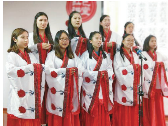
文化路小學的教師國學讀書沙龍活動。