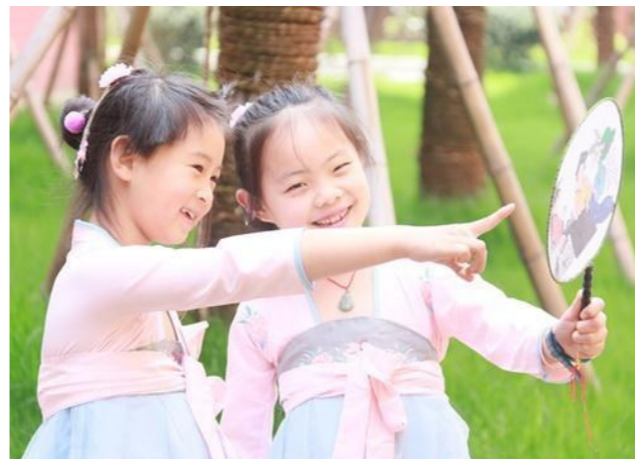
雷石小學開展的“國旗下風采展”的系列傳統文化主題活動。

教育,潛移默化地教給學生做人的道理。此外,還建立了電影課程和傳統文化社團,豐富多彩的校園文化活動,切實把優秀傳統文化貫穿於學生學習生活的方方面面,讓學生在活動中感悟、體驗和接受優秀傳統文化。