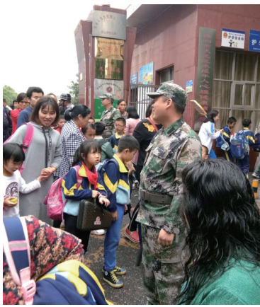
图为四位老兵志愿者在泰山学校门口护学岗护学。

活动得到了学生和家的高度认可。不少家长反馈到,有了老兵志愿者参与,孩子上学放学会更安心。老兵志愿者也表达了他们行动的原因:看到有不法分子拐骗儿童、车辆不按章行驶、小朋友安全习惯没养成等情况,作为老兵,作为社区的一员,该站出来,为社区的孩子们做些事情。