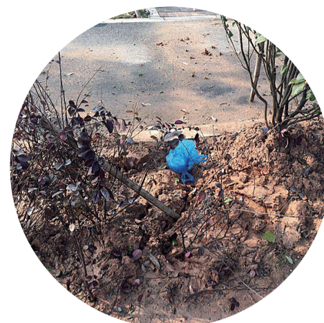
绿化带垃圾未清理

为何屡次不改?追问之下,施工方负责人坦言,一方面是资金问题,另一方面自身管理也存在不足。“这是收尾项目,可能相关人员的积极性不高。”该负责人表示,将立即组织专业的园林施工队伍,严格按照设计图纸整改。