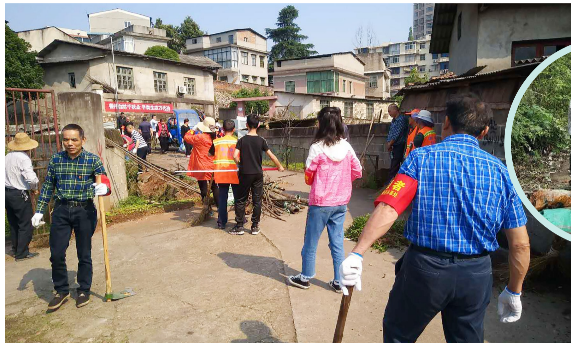
▲荷塘区开展陈年垃圾“大扫除”