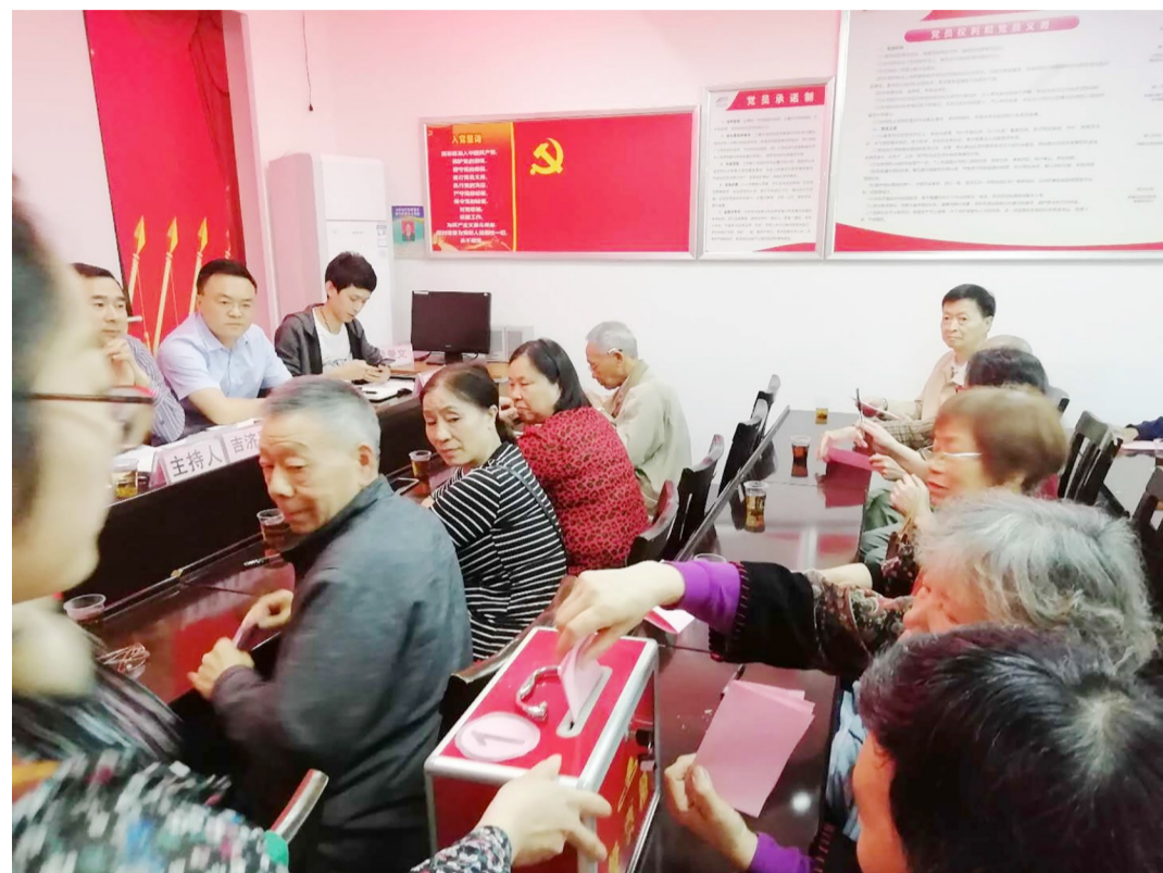
▲5月20日，石峰区社区居民代表票选惠民实事项目现场