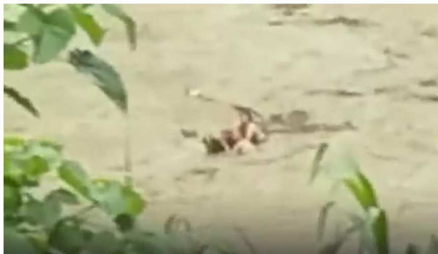
▲夫妻俩被山洪冲进河道,他们抱着树干得以获救 手机视频截图

本报讯(记者 刘玺)前日下午2时多,攸县鸾山镇普降暴雨,一辆小车被山洪冲进水流湍急的河道内,车中坐着一对夫妻。幸运的是,这对夫妻爬出天窗,死死抱住一根树干,最终被当地村民救上岸。