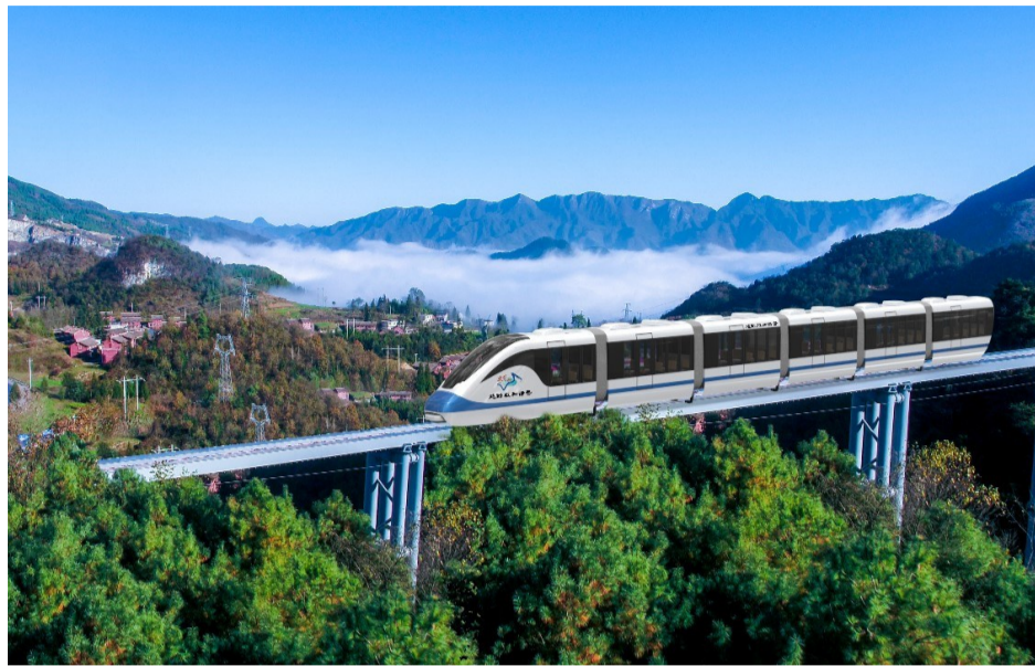
▲独轨观光型“越野版和谐号”效果图

本报讯(记者 伍靖雯 通讯员 欧阳柳)株洲中车特种装备科技有限公司又有新动向!在“5·19”中国旅游日当天,该公司与江西大觉山景区集团有限公司签署项目合同,在景区打造单轨旅游观光列项目——“越野版和谐号”。