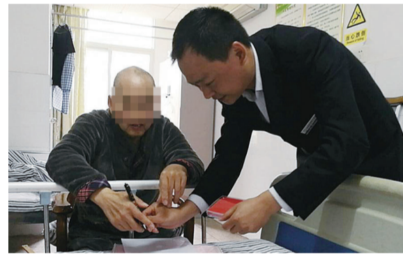
▲住房公积金天元管理部工作人员上门为周老伯办理业务