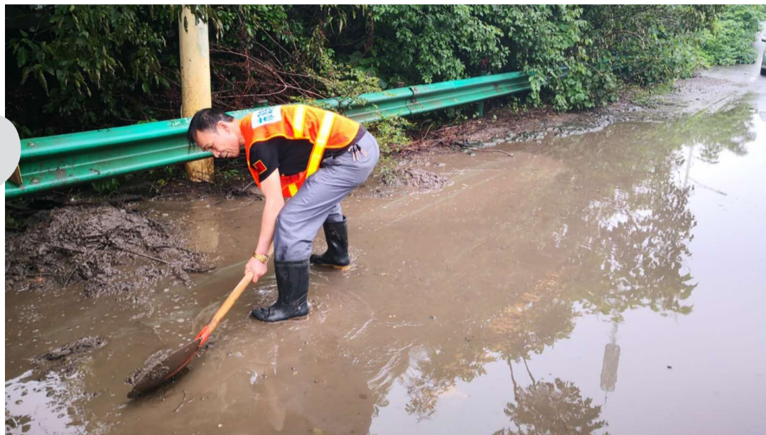
▲暴雨过后,市政人员及时清淤

记者从市防办获悉,两天的强降雨导致攸县、茶陵县、炎陵县出现不同程度受灾,部分水利、交通设施受损,尚无人员伤亡事故报告。目前,这一轮强降雨已经结束,不过24日至26日,全市又将迎来一轮强降雨过程。