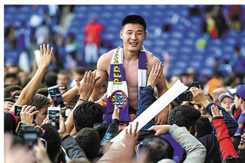
进球功臣武磊被西班牙人球迷扛在了肩上。

据新华社马德里5月18日电 2018-2019赛季西班牙足球甲级联赛最后一轮18日展开。凭借武磊的一记进球,西班牙人主场2:0击败皇家社会,进军欧战。