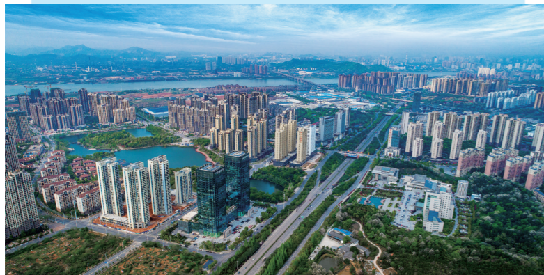
栗雨湖片区全景

从株洲城区各大人居发展的历史来看,栗雨湖片区可以说创造了一个典范,从多角度来比较,这个典范至今尚无其他板块可以媲美。