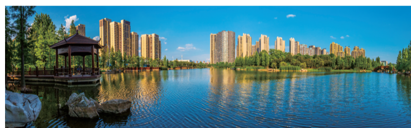
▲栗雨湖畔楼盘林立,风景优美

至今,这一片区的成熟与繁华,丝毫不亚于中心城区成熟地段。要知道,在十年前,栗雨湖片区可是距离芦山路好几个级差的区域,一条环线将其列为“化外之地”。多年之后,环线内靠体育中心一带还有好多地块没有这里的成熟与繁华。