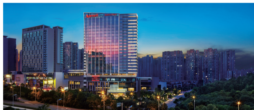
▲美的置业建设20万方城市商业综合体,打造写字楼、酒店、商场,引进株洲美的万豪酒店、麦德龙等国际知名商业品牌

从株洲城区各大人居板块发展的历史来看,栗雨湖片区可以说创造了一个典范,从多角度来比较,这个典范至今尚无其他板块可以媲美。