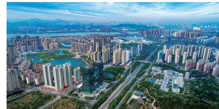
▲如今的栗雨湖片区,已经发展得十分成熟繁华