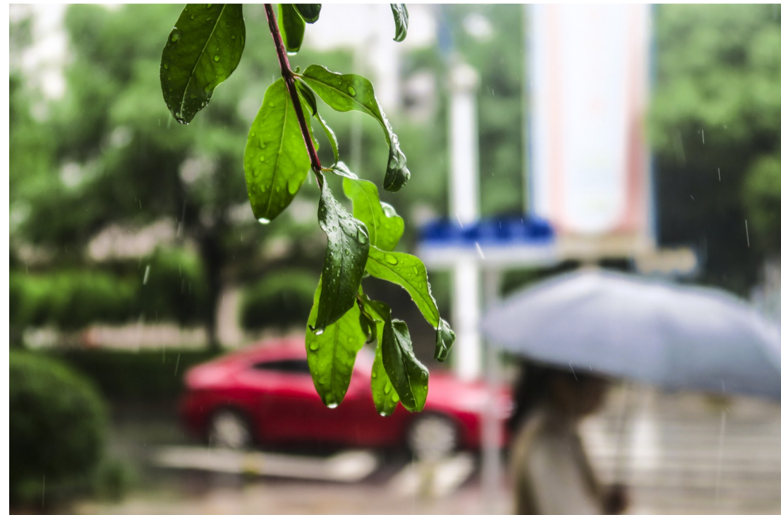
▲5月19日,降雨频频,黄河北路的树叶上盈满雨滴