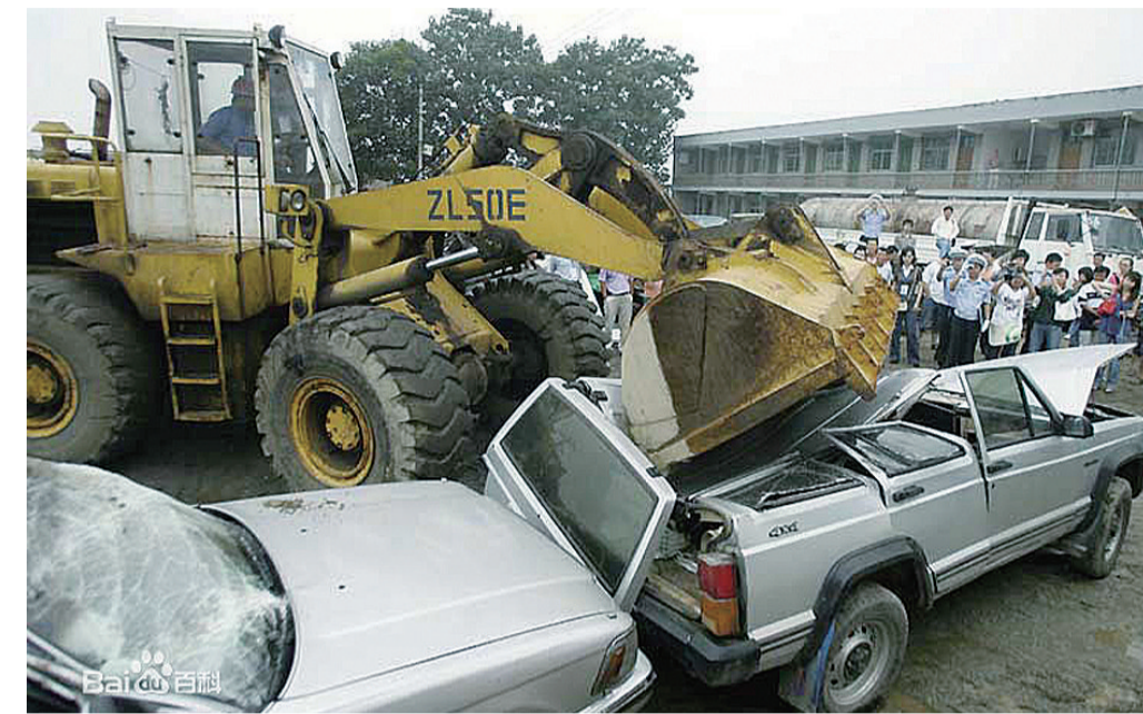
▲报废车处理现场

国务院日前公布了《报废机动车回收管理办法》,办法将于6月1日起施行。同时,2001年公布的《报废机动车回收管理办法》废止。新办法实施后,报废机动车有什么注意事项?记者采访了报废机动车回收行业的代表性组织——中国物资再生协会副会长高延莉。