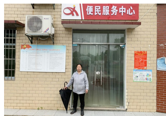
▲卜女士在村部等待,主任一直没有露面