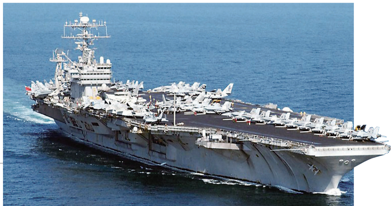
▲美军已派“亚伯拉罕·林肯”号航空母舰前往海湾地区

这一事件无疑凸显海湾局势的危险性和复杂性。由于美国和伊朗紧张关系不断升级,各方均密切关注海湾地区事态变化。