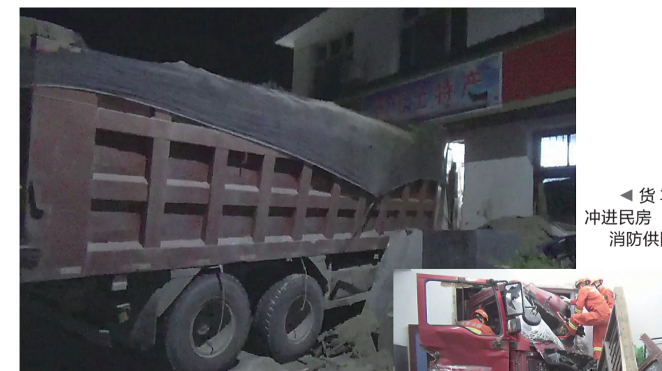
▲货车冲进民房