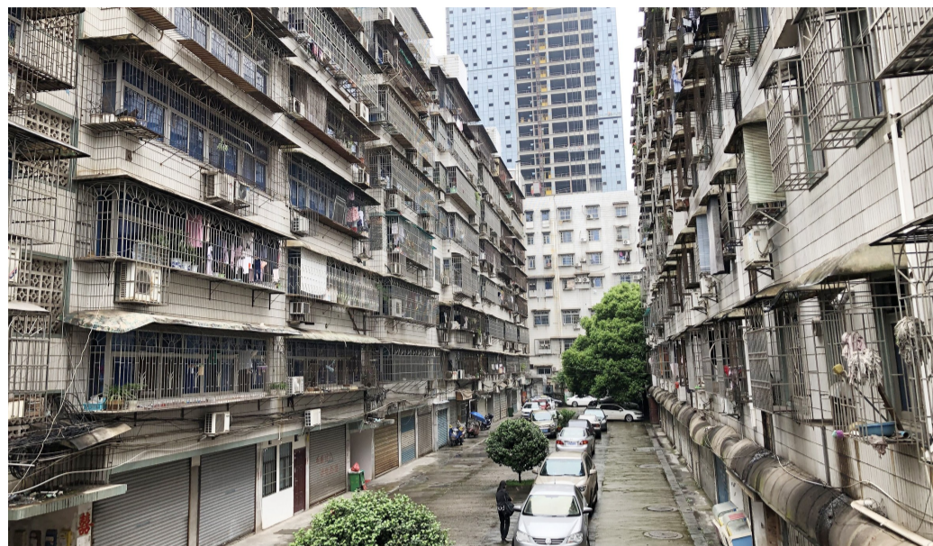
▲保利高尚小区,大部分住户都是老年人