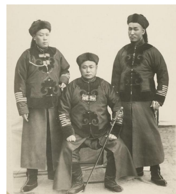
▲ 图为三位带刀侍卫。大金刀坐姿很霸气