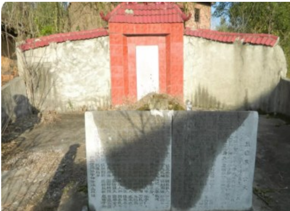
廖希颜之墓静静地守护在茶陵洙水河畔,至今近500年了。

清雍正年间,协办内阁大学士彭维新(茶陵人)在《三关志序》中称《三关志》是“承平之