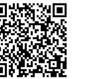
网约护士微信二维码