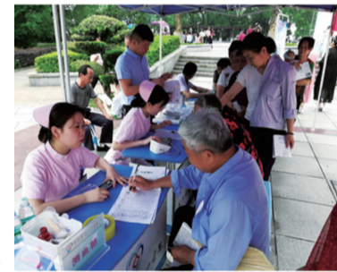
(记者 刘玺/文)

随着现代医学模式的改变,在“以人民为中心,以健康为中心”的健康观指导下,该院围绕如何促进人民的健康为主导,开展了一系列工作。医院及各科室充分利用网络平台,如微信、QQ群、微视频、公益广告、电子屏、电视视频等形式向广大病友及群众开展健康知识宣传、疾病管理。大力开展健康宣教和控烟工作,修订和完善有关制度和职责,按要求悬挂宣传横幅、标语,更换劝烟袖章、张贴禁烟标识、制作禁烟台签,更新健康宣教栏和海报、修订各科健康教育折页和处方,还被评为“无烟管理示范单位”。