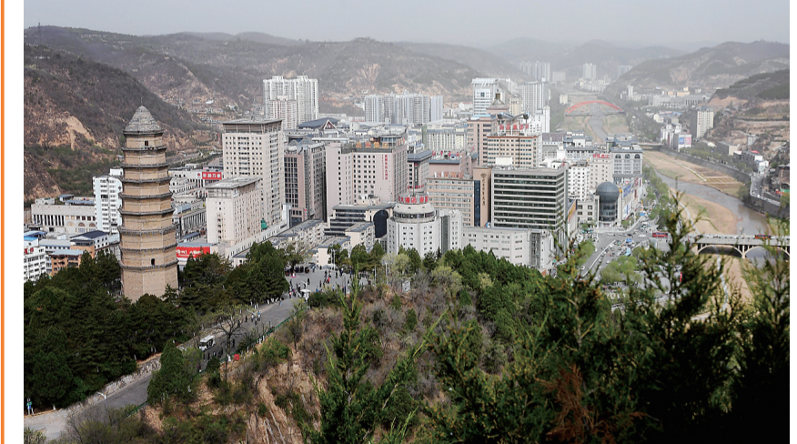
这是一张拼版照片,上图为:抗战时期的延安城(资料照片);下图为:4月24日拍摄的延安城。

新华社西安5月7日电(记者 沈虹冰 梁娟 陈晨)陕西省政府5月7日宣布,延安市延川、宜川两县退出贫困县序列。这标志着革命圣地延安的贫困县全部“摘帽”,从此告别绝对贫困,226万老区人民开启奔向全面小康的新生活。