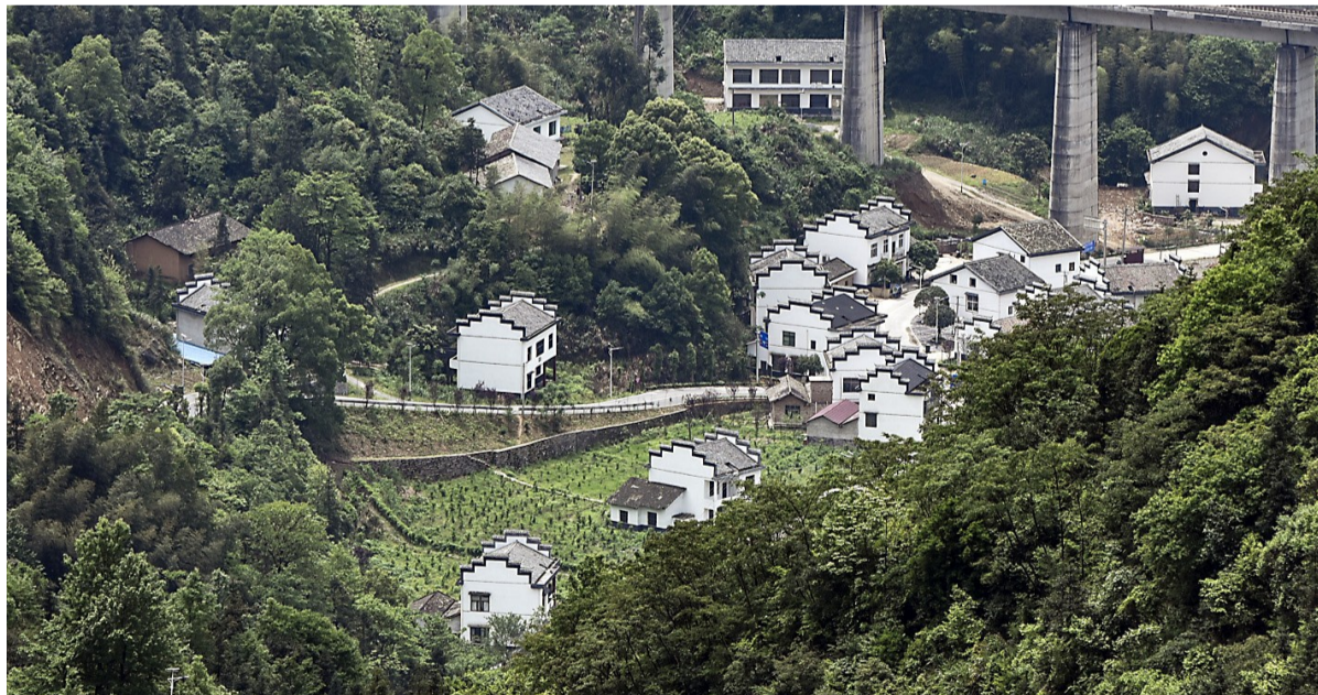
美丽的隆兴坳。

事实上,隆兴坳村原本地处偏远,村民收入来源主要是外出务工,改变源于这几年的美丽乡村建设——以“村民筹工筹劳、政府奖补”的形式,累计投资400余万元,400多栋房屋按照徽派建筑风格统一进行风貌改造;开展垃圾分类试点,投放垃圾分类垃圾桶1100个,对村民房前屋后的