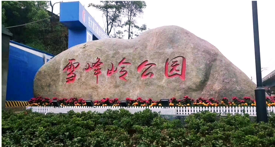
▲雪峰岭城市公园位于轨道科技城中部,紧邻田心东站

本报讯(记者 李卉 通讯员 谭洪汀)昨日,记者从石峰区获悉,生态休闲结合轨道文化元素的雪峰岭城市公园于5月1日对外开放。