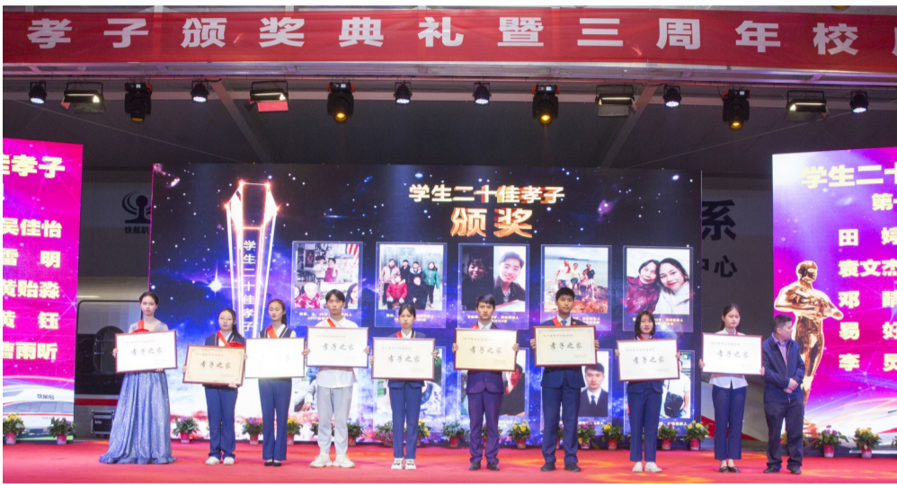
▲4月27日晚上,部分孝子上台领奖

本报讯(记者 何春林)百善孝为先,孝为德之本。4月27日,株洲铁航职业学校在全校评选了首届“二十佳孝子”。