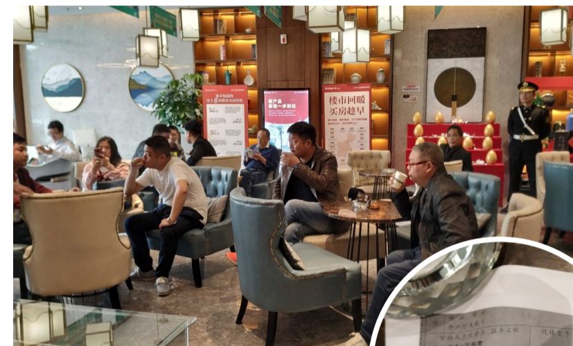
▲业主在售售楼部讨说法