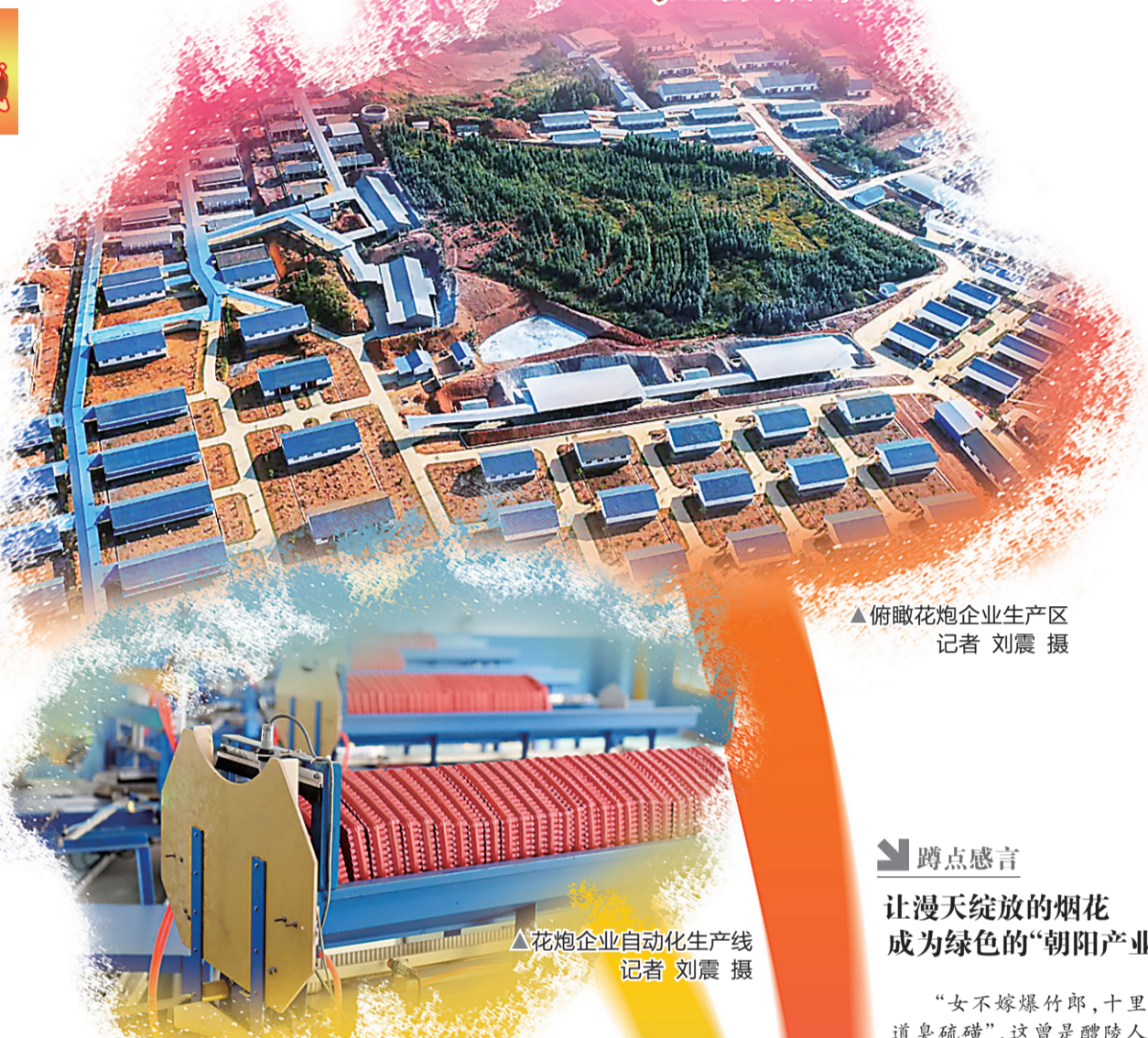
▲俯瞰花炮企业生产区