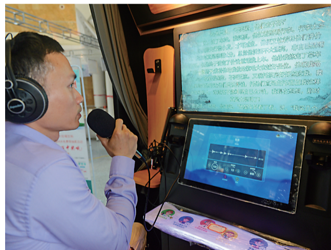
“株洲读书月”期间,一名读者在“朗读亭”里深情朗读。

曾茉莉说,听音频书也不贵,“一些播主的包年订阅通常只要三百多元,碰到一些时间节点还能享受较大折扣。”至于为何参与读书会,女文士说,和大家一起读让她受益匪浅,“它激发了我读书的热情,也锻炼了我朗读的水平,更让我交到了各行各业的朋友。”