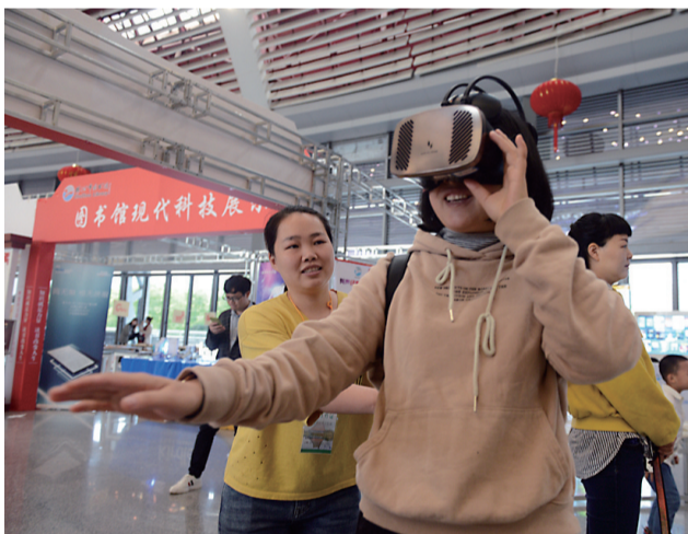
4月23日,一个读者在神农大剧院的“株洲读书月”活动现场体验VR数字阅读。