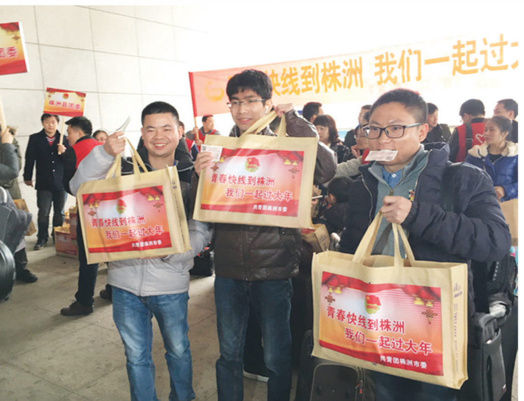
“青春快线 暖冬行动”青年志愿服务广受好评。

株洲共青团抖音账号自2019年初创立认证以来共发布作品56件,总获赞224.3万,粉丝6.6万+,综合成绩连续12个月保持全省第一方阵。官方微博推出的“火热的青春突击队”等一系列主题推文,对于共青团助力株洲中心工作有力推介。