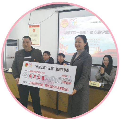
团市委发放“希望工程一元捐”爱心助学金。

2014年,“赢在株洲”株洲市第二届青年创新创业大赛,共收到269个报名项目,通过初审、复审和通审,最终确定70个项目进入总决赛,项目涉及电子信息、食品安全、新材料、生态农业、绿色环保、新兴服务业等多个领域。