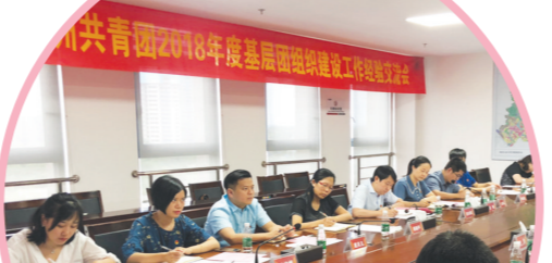
进行基层团组织规范化建设经验交流。

曾忘记,“心手相牵 快乐成长”爱心助学活动走进茶陵县界首镇中心小学,广泛发动市青联委员、青企协会会员,提倡每人捐出一日收入作为善款。不曾在记,“心手相牵 快乐成长”爱心助学捐赠陵炎县平乐乡小学爱心善款10万元,用以改善偏远山区贫困学校办学条件。不曾在记,资助界首镇铁岭村的160名在校中小學生,缓解他们的学业压力。