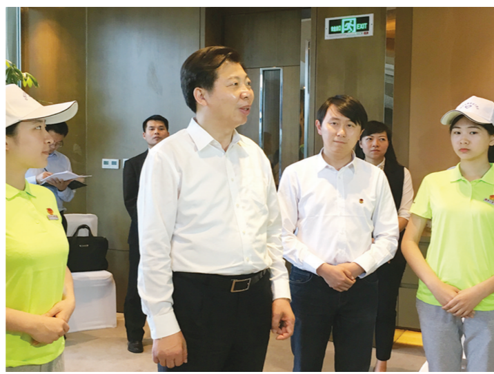
▲市委书记、市人大常委会主任毛腾飞看望青年企业家志愿者——“小青桔”。

在实际办理未成年人案件中,“合适成年人”积极配合公检法等单位开展工作。在接到工作安排后1小时内到达现场,依法行使法定代理人的部分诉讼权利,并履行监督、教育、感化、挽救等职责。数据显示,2018年,我市“合适成年人”志愿者共参与办理未成年入案件25件,开展监督考察、社区矫正活动50余次,有效维护了涉案未成年人的合法权益。