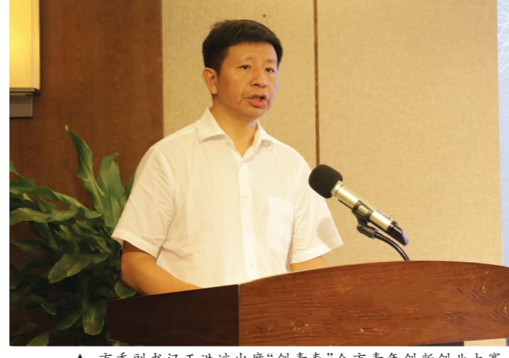
▲市委副书记王洪斌出席“创青春”全市青年创新创业大赛。