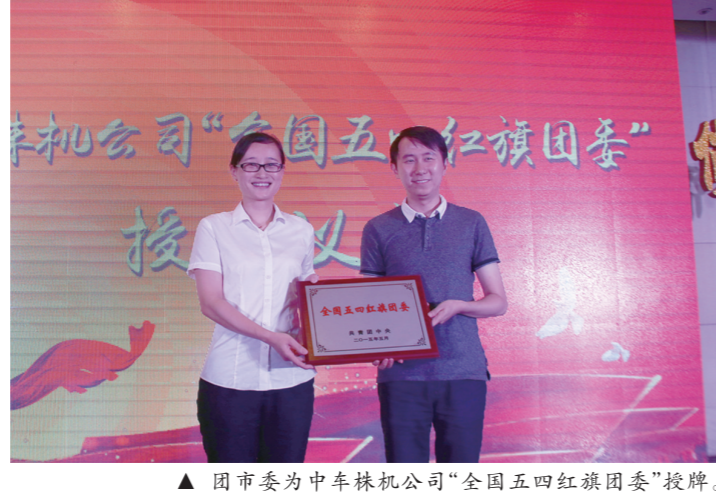
▲团市委为中车株机公司“全国五四红旗团委”授牌。