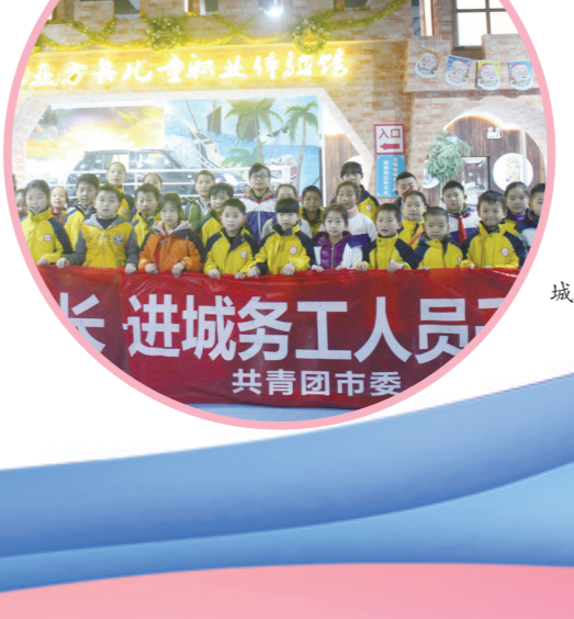
主动服务进 进城务工人员 共青团市委