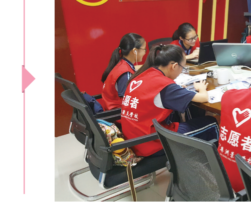
“一心双环”团组织格局有序形成。

青年社会组织蓬勃发展。株洲市青年社会组织孵化基地建设以来,累计孵化青年社会组织43家,站外培育68家,积极推介志愿服务项目。“雨润新芽·花季护航”关爱青少年儿童成长项目荣获“第二届中国青年公益创业大赛金奖”,“稻香农人行动”驻校社训项目荣获“第三届全国青年志愿服务项目大赛银奖”。