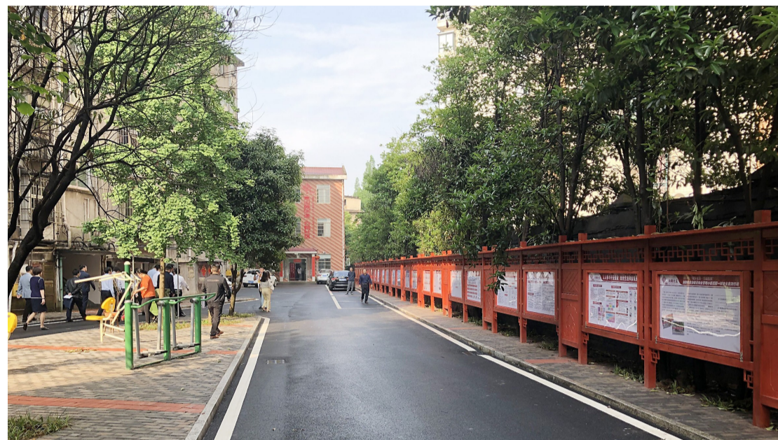
▲整治一新的花园一村

本报讯(记者周嵩 通讯员周游)昨日上午,“城乡统筹·幸福株洲”创新社会治理系列行动第一季度讲评会在天元区召开。