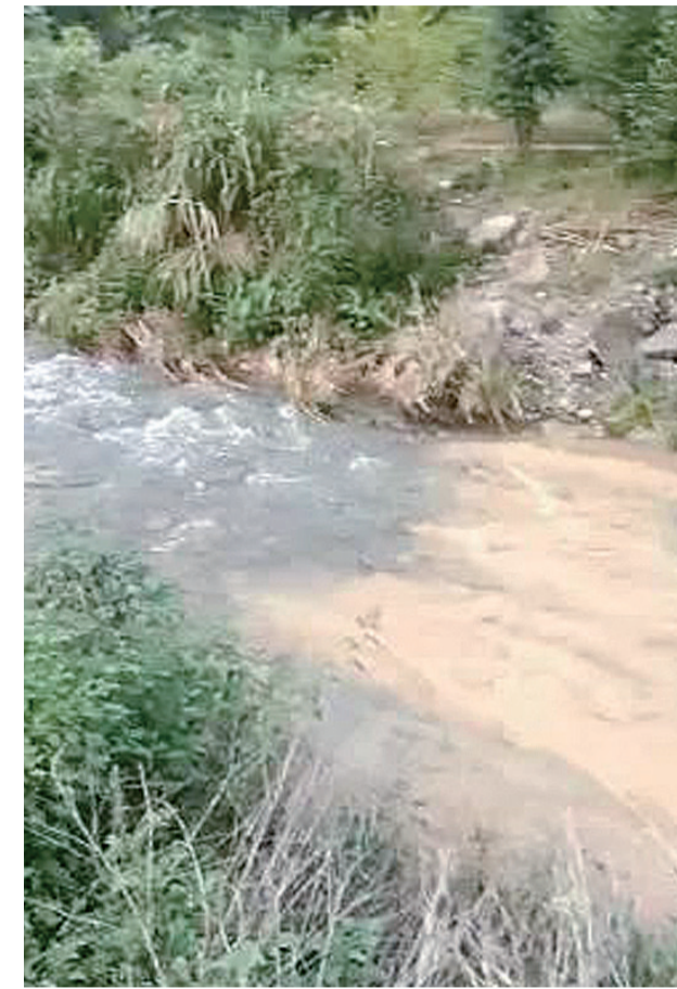
▲溪水途经“分界线”,由清变浊 视频截图