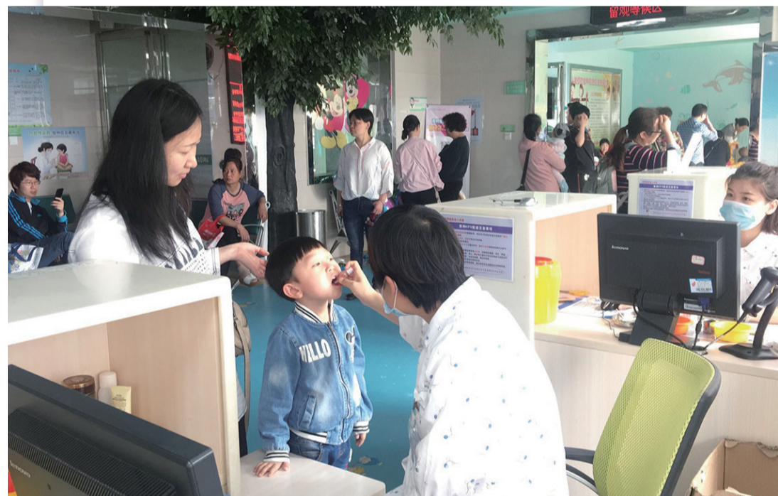
接种疫苗是预防控制传染病最经济最有效的手段。

4月25日是第33个“儿童预防接种日”,今年的宣传主题是:防控传染病,接种疫苗最有效,口号是:儿童健康是大事,接种疫苗要及时、接种疫苗共筑健康屏障、依法接种疫苗有效预防疾病。