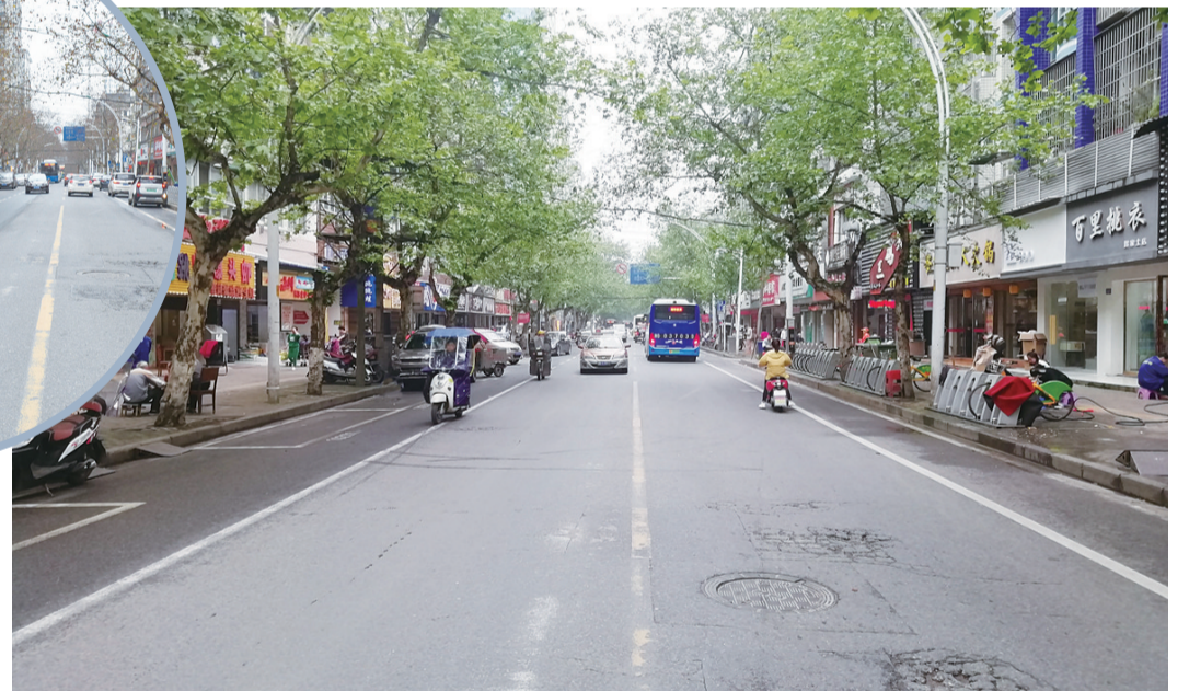
▲芦淞区人民路贺嘉土路段实施收费后现状。