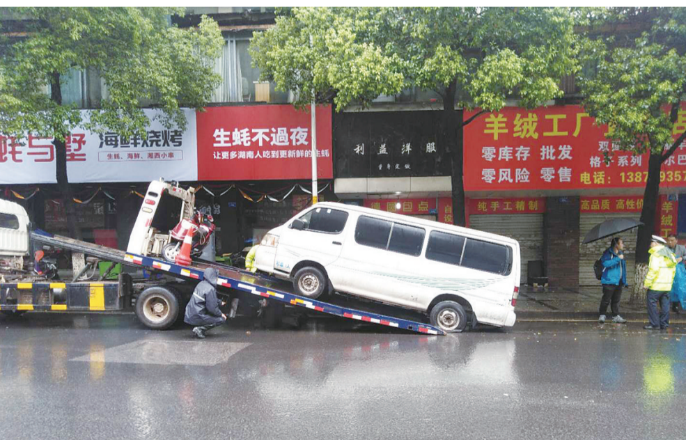
芦淞区人民路一台停放256天的“僵尸车”被拖离。

据悉,自停车收费实施以来,还有很多巡管员捡到手机、证件、文件和钱包,都及时归还了失主,获得市民纷纷点赞。