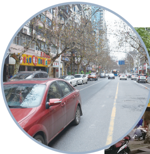
▲芦淞区人民路贺嘉土路段实施收费前景象。

不只是“僵尸车”被陆续清理,一些道路隐患也因此被及时发现并清理。4月11日,一位停车巡管员在芦淞区解放街巡查时,意外发现了停车泊位边的两个石墩。交警介绍,该处石墩非常隐蔽,但极易引发交通事故。通过层层反馈,交警、城管部门联合将该处隐患拆除清理。记者还发现,在人民路、纺织路及合泰路等路段,周边店面在泊位设置了障碍,霸占车位,在交警、城管部门的积极处理下,障碍得到清理,赢得市民一片叫好声。