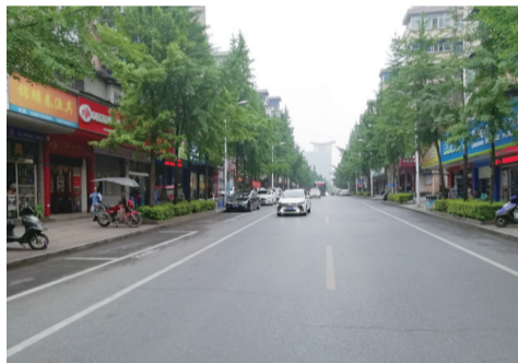
收费后:荷塘区钻石路随到随停。