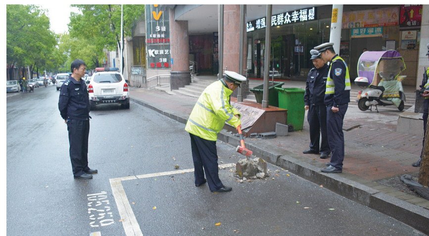
解放街停车泊位边的两个违规设置的石墩被清理。

市城管支队相关负责人表示,已将违停整治作为近期的考评重点。另外一个好消息是,人行道违停处罚系统即将完成调试,届时,城管队员发现人行道违停车辆后,可直接录入交警系统进行处罚,对违停车辆将会产生更大的震慑作用。