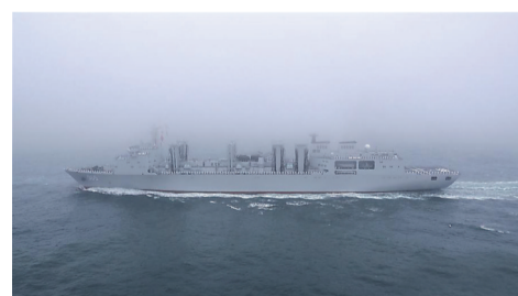
▲“呼伦湖”号综合补给舰