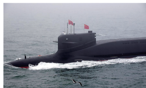
▲中国某新型核潜艇