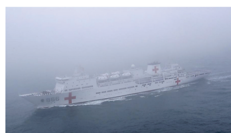
▲“和平方舟”号医院船