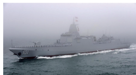
▲“南昌”号导弹驱逐舰