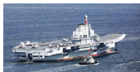
▲“辽宁”号航空母舰(资料图)