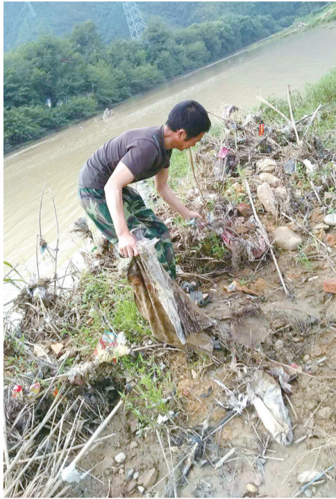
“河长”在巡检河道。