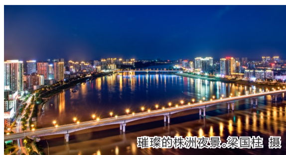
璀璨的株洲夜景。梁国柱 摄

你见过怎样的株洲?也许你去过每个角落,也许你见过四季轮回,也许你看过城市的晚霞,迎接过神农湖的朝阳。你是否也曾想过,希望自己像鸟儿一样,离开地面,冲上云霄,换个角度看看我们的城市。株洲摄影爱好者“写给梦想的信”,用几个月的时间,航拍了株洲主要地标并连成一体,制作了一张“株洲VR大全景”。你可以在各个场景中进行切换,360度在天空观看我们的城市,感受株洲发展给你带来的震撼。