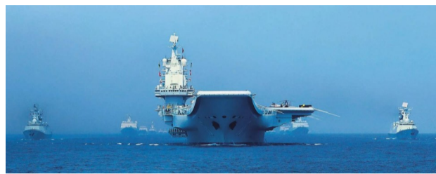
人民海军的威武雄姿