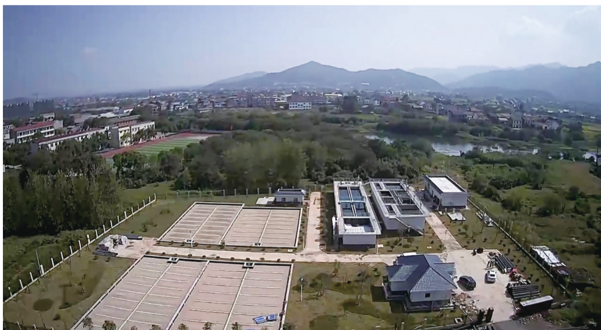
醴陵市白兔潭镇污水处理厂全景