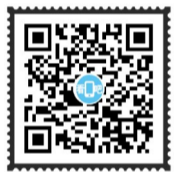
扫码观看震撼VR,俯瞰2019中国海军主力舰艇全图