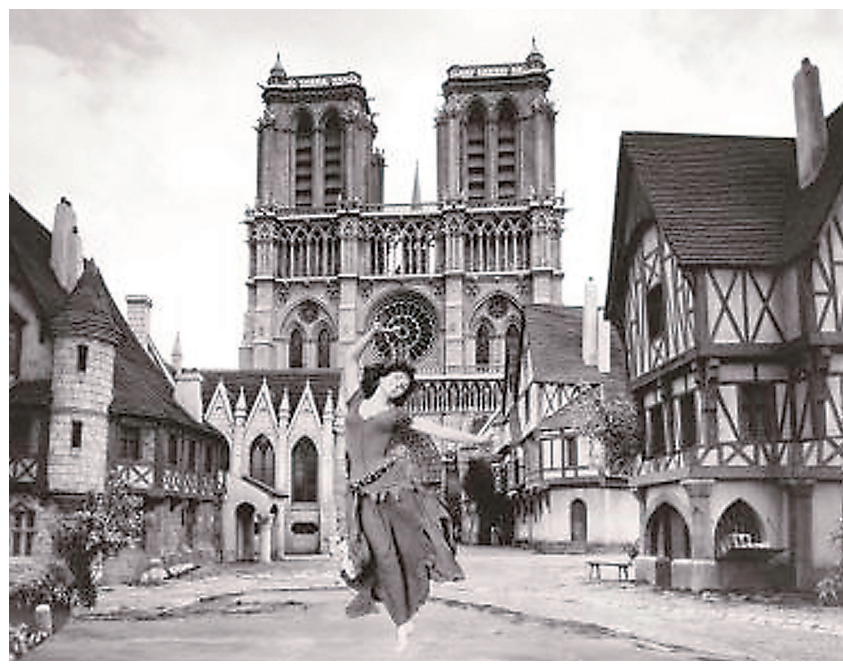
1956年版《巴黎圣母院》中,意大利女演员吉娜·劳洛勃丽吉达,演出了吉普赛女郎埃斯梅拉达的野性与活力。

《巴黎圣母院》被翻拍了多少次已很难统计。最早的一版电影长片有可能是1923年,由环球影业拍摄的默片《钟楼怪人》。以恐怖片闻名的环球影业,自然不会放过这出发生于神秘哥特式建筑中的悲剧。在诸多版本中,最为观众熟知与认可的,要算美国雷电华公司制作的1939年版,以及让·德拉努瓦执导的1956年版。查尔斯·劳顿饰演的卡西莫多,是1939年版本的亮点,极致丑恶的妆容效果,配上精湛的演技,让观众印象深刻。只是,这一版没有跳出好莱坞的媚俗套路,不但增加、重改不少感情戏,还将悲剧结局改为大团圆结局。在秉持原著精神上,1956年版无疑可圈可点。一头深棕秀发,一身红衣,身材热辣的意大利女演员吉娜·劳洛勃丽吉达,演出了吉普赛女郎埃斯梅拉达的野性与活力,尤其是在片中的一段歌舞演绎,成为经典片段。