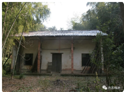
晏福生老家原来的房子