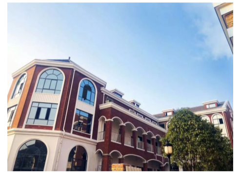
云顶栖谷幼儿园。

云顶栖谷幼儿园为周边适龄儿童提供了环境优美、设施齐全、功能完备的生活、学习场所。项目的建成将进一步完善云龙示范区的教育配套,缓解幼儿的入学压力。