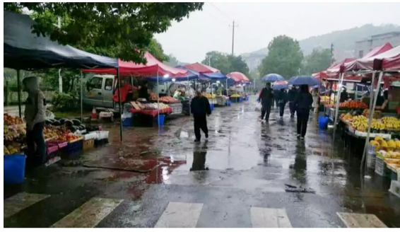
董家墩街道城管中队设立的疏导区。

经过耐心细致的商讨,董家墩街道城管中队设置了临时水果疏导区,经营户须在规定的区域、时段内规范有序经营。同时,疏导区内