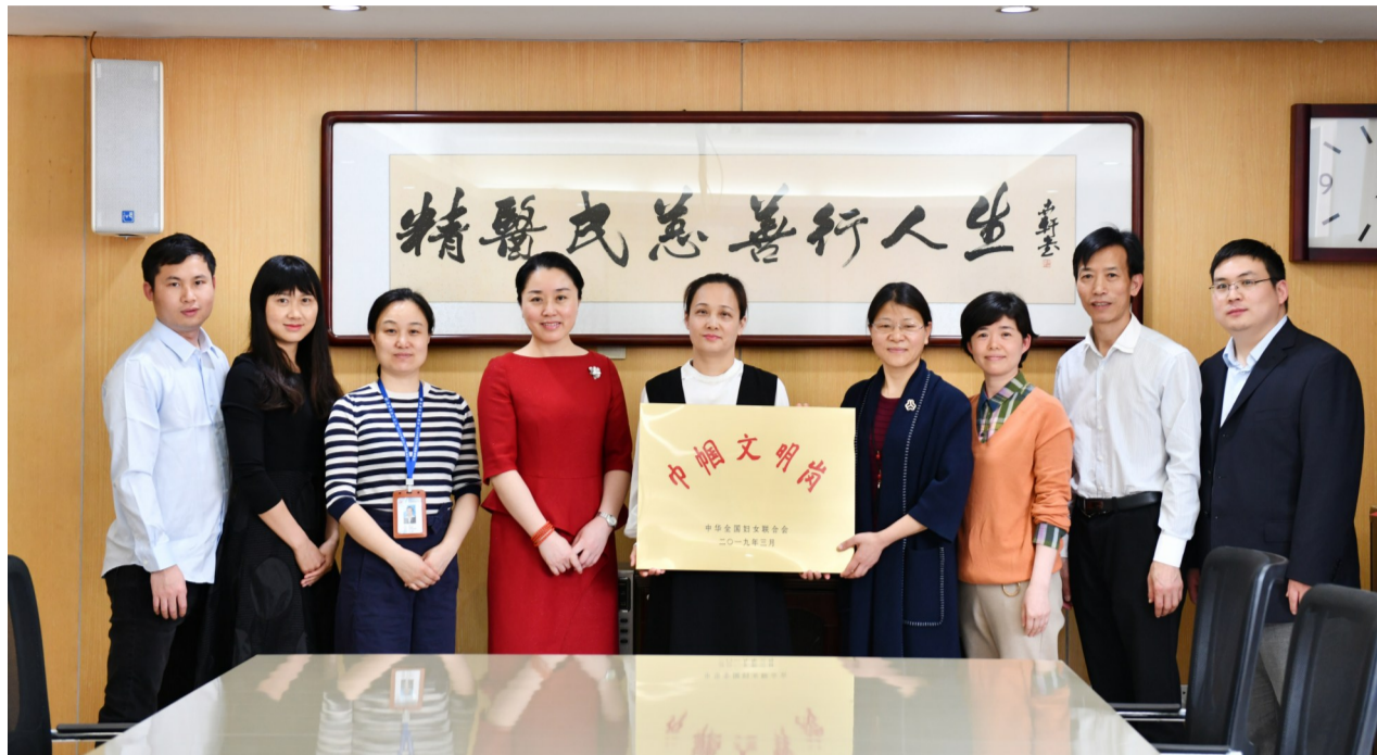
市中心医院手术室被授予全国“巾帼文明岗”奖牌。

他们就是手术室护士,被称为“无影灯下守护生命的天使”。近日,市中心医院手术室荣获全国“巾帼文明岗”称号,成为我省唯一一个获此殊荣的护理团队。