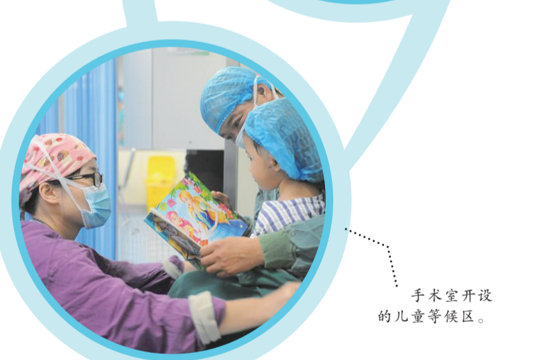
手术室开设的儿童等候区。