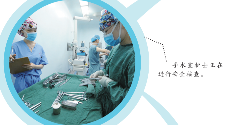
手术室护士正在进行安全核查。

日复一日的高标准要求锻造了一支能打胜仗的队伍。在湖南省举行的2015年手术室操作技能竞赛株洲地区分赛中,该科室囊括了株洲地区手术室操作技能竞赛的一、二、三等奖,荣获湖南省三等奖;该科室承办并参与了2017年、2018年株洲市《手术室护理实践指南》授课选拔赛,并于2017年斩获一等奖及二等奖,2018年囊括了株洲市授课选拔赛的前五名。