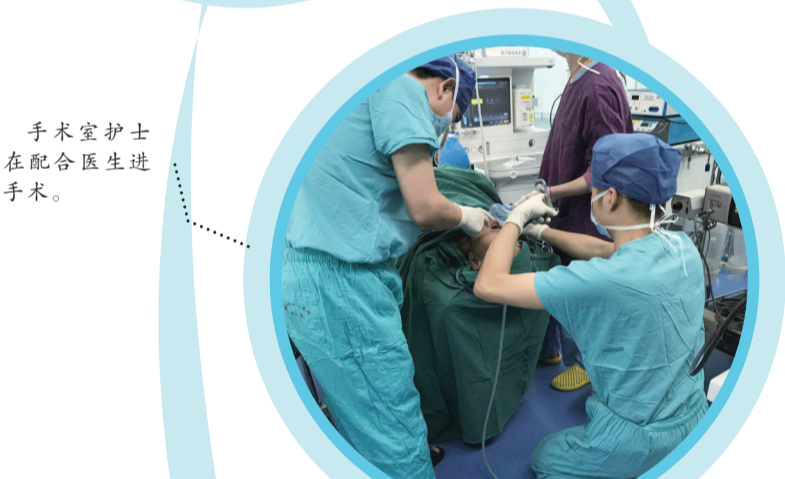
手术室护士正在配合医生进行手术。