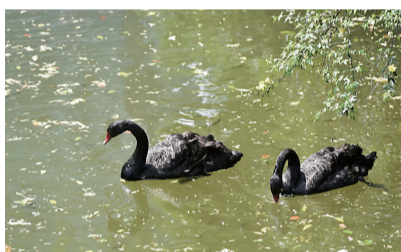
天鹅湖内一对美丽的黑天鹅。

近日,一对黑天鹅在天鹅湖公园安家。这对“宝贝”刚一下水,就吸引了众多市民前来观赏,用手机记录它们在湖内嬉戏的精彩瞬间。据悉,这是目前全市唯一可观赏黑天鹅的公园。天鹅湖公园管理处相关负责人介