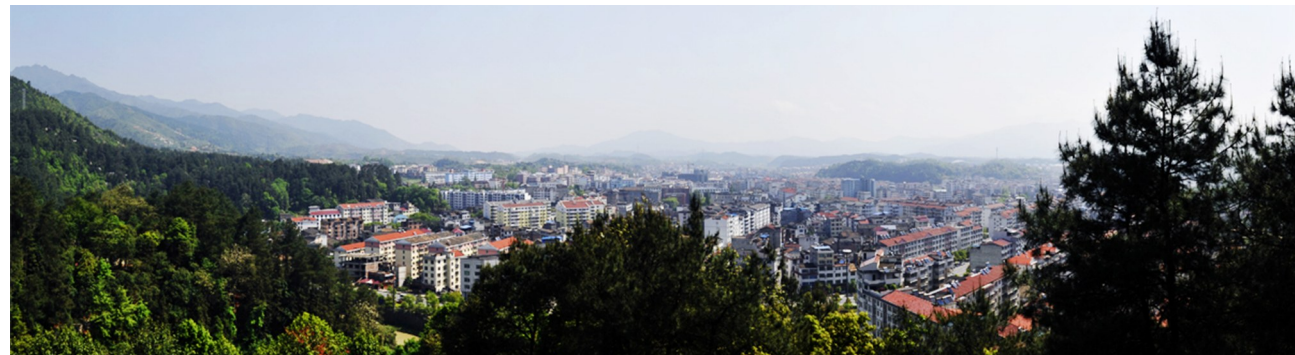
美丽的炎陵县城。

这仅是该县壮大城市框架的一个缩影。“一支香烟绕个圈,屋檐滴水湿两肩。”这是人们对过去的炎陵县城的印象。县城建成区面积仅1平方公里,人口2万,给人的印象是破旧、窄小、杂乱无序。