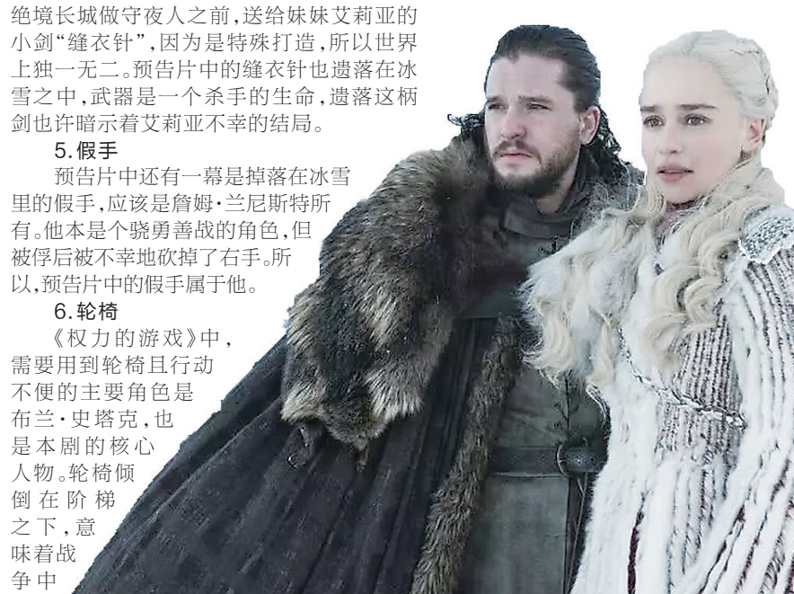
《权力的游戏》第八季剧照