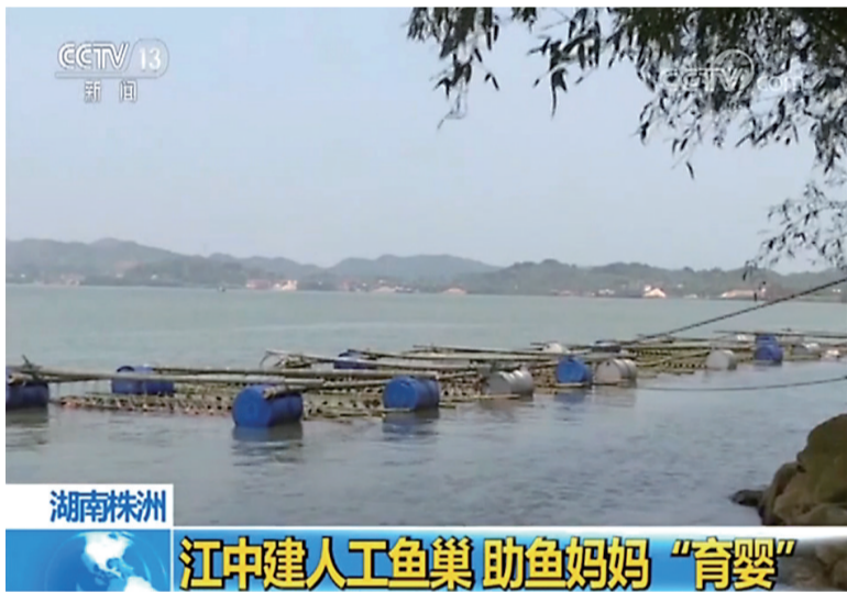
湘江四洲站河段的人工鱼巢(视频截图)。