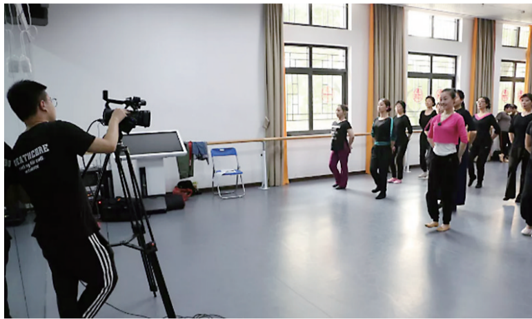
教学现场做全程直播,让不能到现场的市民也可以在线学习。