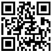
扫一扫,即可登录“马上就办”网络问政系统。

市住建局回复:经核实地下车库漏水情况属实。开发商已安排施工队伍正在维修处理中。计划在4月10日之前完成,市住建局将跟踪督促。