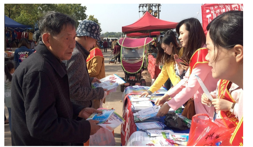
日前,云龙示范区劳动和社会保障局在云龙假日广场开展社保宣传日活动。当天工作人员在现场免费发放宣传资料,讲解人社惠民政策,为群众解答社保、就业等热点问题,增强了企业和群众对国家政策的知晓度。因为活动现场。(谭德华)